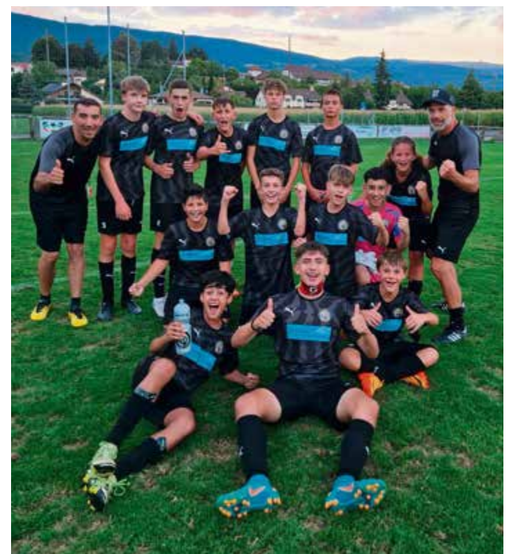
Photo: Juniors C1

JA 17h, Saint-Imier: TV – Herzogenbuchsee