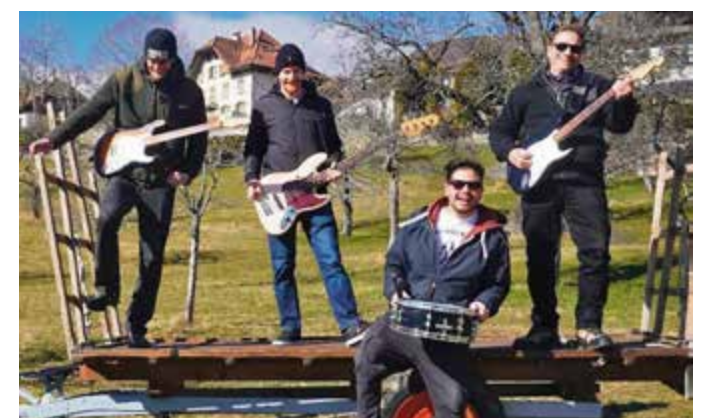
Les Monoaxes, groupe régional qui vous fera vibrer, photo: jcl

Sophie venant tout droit d'Allemagne, bien connue pour sa gouaille vocale et ses rythm and blues brûlants des années 40-50. Un programme bien rempli Pour le samedi 3 septembre, pas moins de trois groupes au programme; dès 18h, The Flying Donuts de Bienne, puis à 20h les Monoaxes, le groupe régional et à partir de 22h, le groupe Rockabilly Bones de Lucerne. Ambiance garantie. | jcl