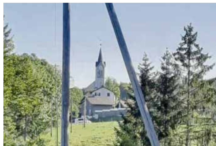
L'église sous un autre angle! Nouvelle offre à la Paroisse de la Ferrière.

La sécularisation, ce mouvement de retrait des choses spirituelles de la vie quotidienne, a, bien sûr, affecté également La Ferrière. On n'est pas contre l'église, on s'en désintéresse peut-être un peu, on n'en a moins besoin, on l'a perdue de vue, on ne s'en préoccupe pas vraiment, elle ne nous touche plus beaucoup.