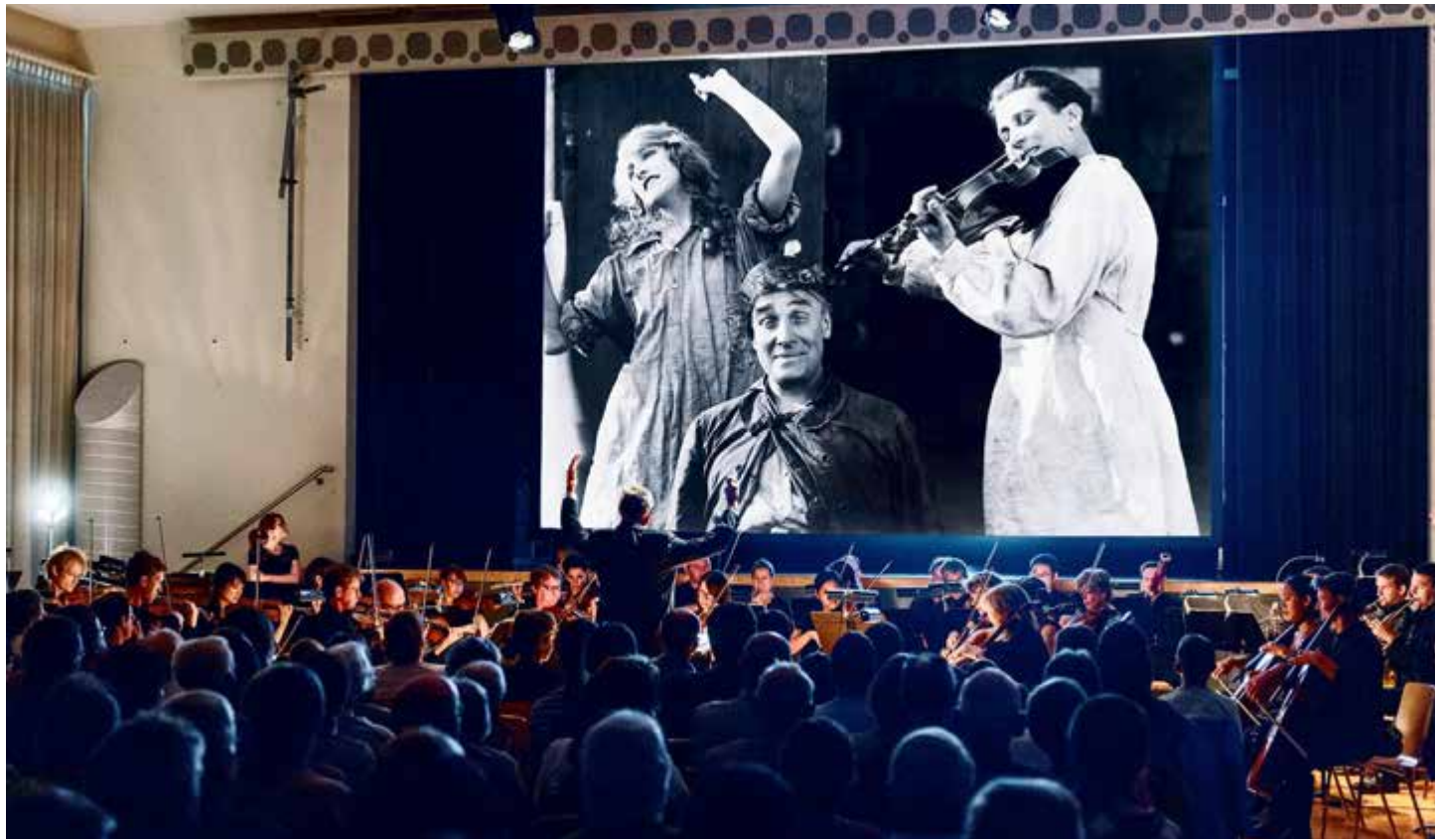
L'accompagnement en direct par l'Orchestre des Jardins Musicaux du film muet La Roue , d'Abel Gance, à Saint-Imier, a constitué l'un des moments forts de l'édition 2022 des Bal(l)ades...

Comme chaque année depuis 2011, la fréquentation a été à la hauteur des attentes puisque près de 1400 personnes ont fréquenté les divers événements proposés sur six lieux différents. L'édition 2023 réserve une belle surprise sur le site de Rondchâtel.