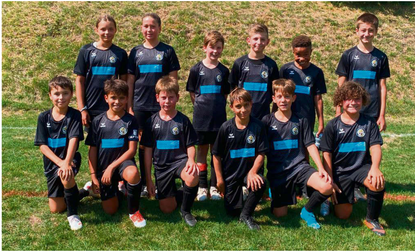
Les juniors D Sommer tout fiers d'étrenner leurs nouveaux maillots

Les juniors D Zakaria ont effectué leur premier match de championnat et se sont déplacés sur le terrain du FC Val-de-Ruz. Le premier tiers voit l'équipe locale ouvrir le score après 15 secondes de jeu face à une équipe fantomatique. Cette entame de match ratée a eu au moins le don de réveiller les joueurs du Team Vallon qui, peu à peu, se sont mis au niveau de l'adversaire. Dès le début du deuxième tiers, l'équipe visiteuse est revenue sur le terrain avec de meilleures intentions, une plus grande combativité et beaucoup plus d'envie. Malheureusement, malgré de réelles occasions, cela ne s'est pas traduit au score et l'équipe neuchâteloise a pu atteindre la pause en menant toujours d'un petit but. Après les 2 premiers tiers joués sur un rythme élevé par l'ensemble des joueurs, on aurait pu croire que la fatigue allait plomber la dernière partie du match. Il n'en fut pourtant rien et on a pu assister à une dernière période de folie, avec des actions en veux-tu-en-voilà d'un côté à l'autre du terrain. A ce moment-là, le match aurait pu basculer d'un côté comme de l'autre, mais rien n'y a fait, et c'est sur la plus petite des marges que les jeunes Valloniens se sont inclinés au final. Très belle prestation des joueuses et joueurs du Team Vallon malgré la défaite.