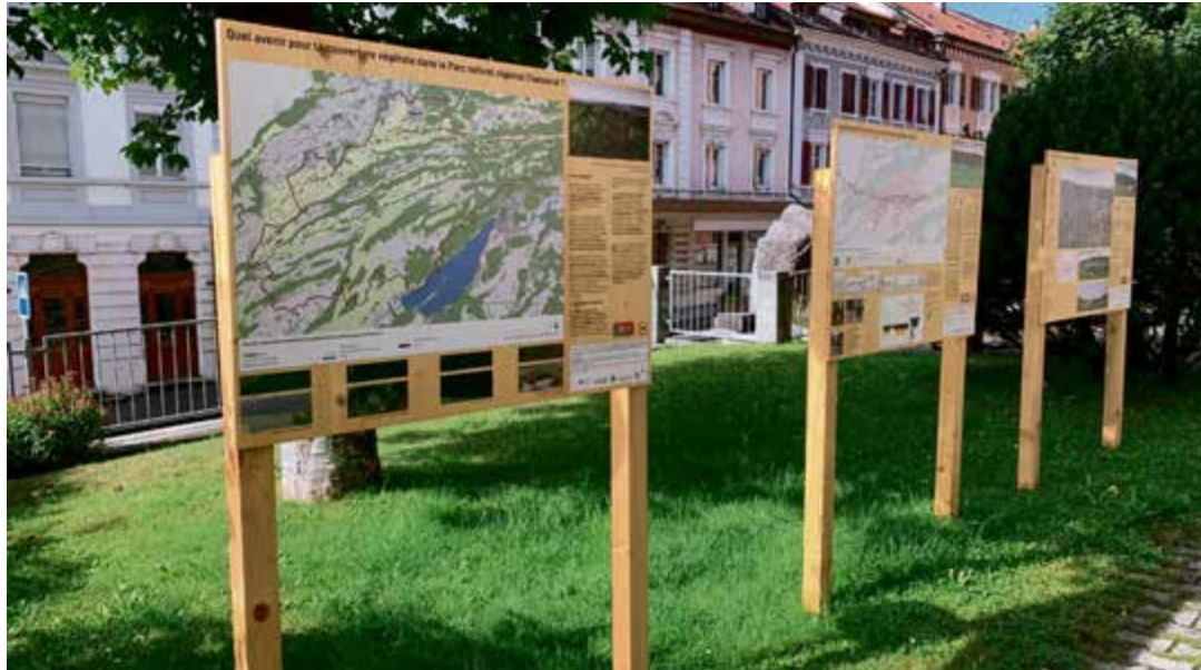
Des panneaux d'informations sur les traverses, la mobilité, le paysage ou la biodiversité sont disposés tout au long du parcours.

Deux visites guidées sont proposées dans le cadre des Journées européennes du Patrimoine, avec deux départs à 13h et 15h30 depuis le parvis de la paroisse de l'Eglise réformée (Grand-Rue 120). La visite, d'une durée de deux heures, permettra de découvrir les traverses ainsi que le projet de valorisation de ce patrimoine, mais aussi les éléments emblématiques de Tramelan qui les longent, comme les jardins et autres espaces verts en friche. La visite est offerte par le Parc Chasseral.