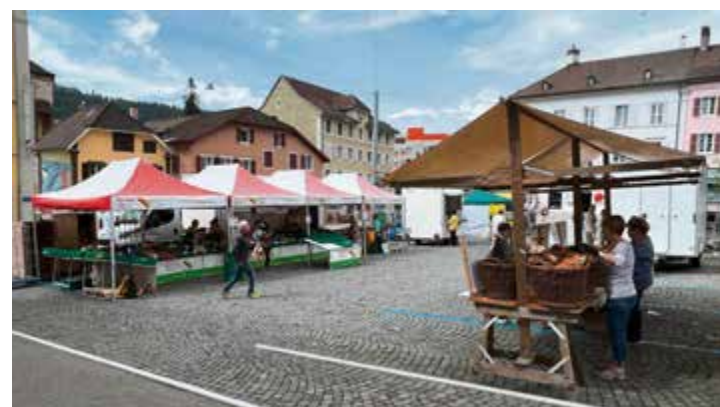
Les commerçants proposent leurs produits le mardi et le vendredi dès 8 h et en tout cas jusqu'à midi