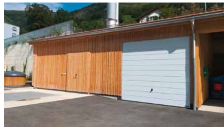
Profitez, le 10 septembre, de cette occasion unique de découvrir toute la technologie qui se cache derrière cette paroi et derrière l'appellation EcoLogis SA

De 9h à 11h30, les portes demeureront largement ouvertes à la chaufferie de Péry et à celle de La Heutte.