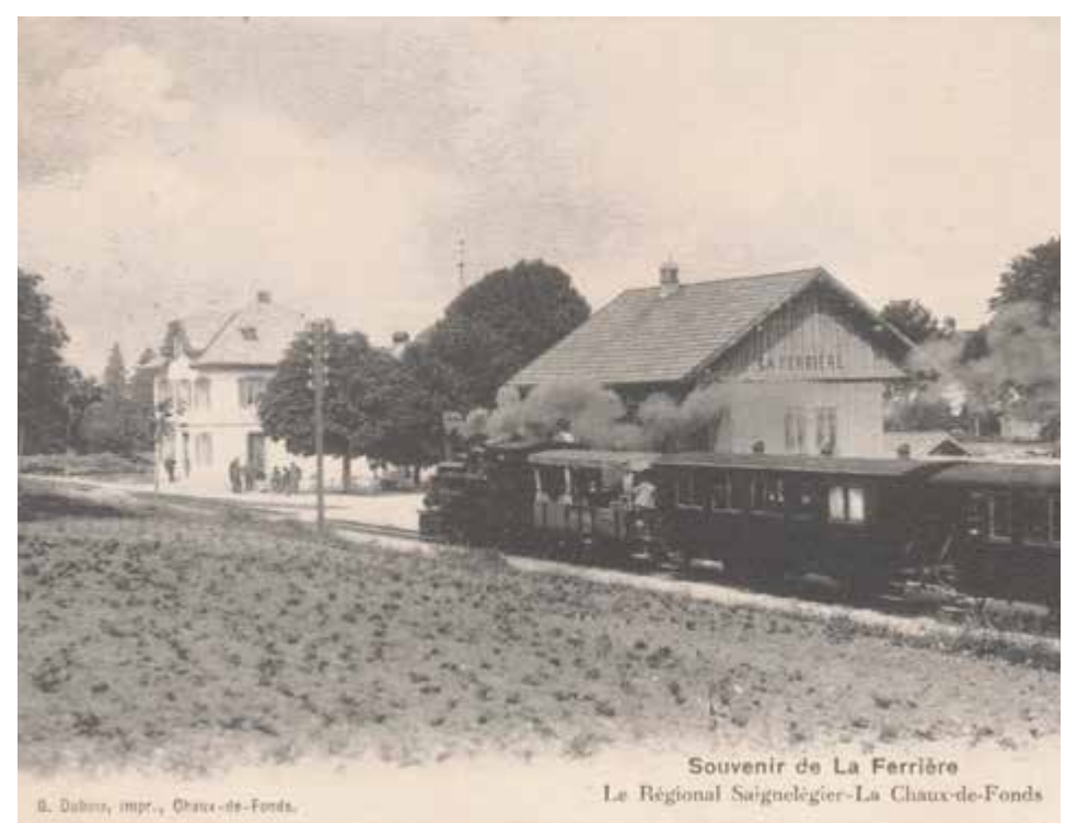
S. Dubois, impr., Chaux-de-Fonds.