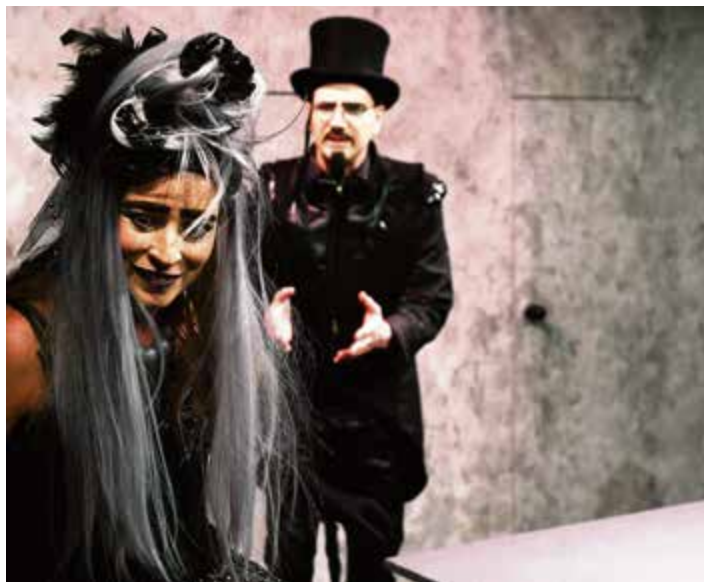
Théâtre Sans Gage, un spectacle de Boris Vian originaire de Saignelégier

Le deuxième semestre de l'année 2022 s'achèvera avec une pièce de théâtre Idols , La Compagnie des autres . Cette pièce de spectacle-concert raconte l'histoire de deux personnes qui partagent un rêve: devenir des stars sous le feu des projecteurs. Mise en scène par Clémence Mermet qui