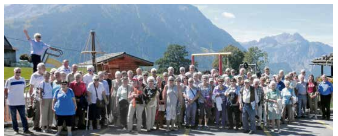
Les participants de cette course 2022 s'en sont mis plein les yeux, par des conditions météorologiques idéales

Détendus après cette petite pause sous les tropiques, les participants sont remontés à bord, pour bientôt quitter l'autoroute afin de sillonner les petites routes sinueuses entourées de hautes montagnes. De quoi admirer la vue imprenable sur LA reine des Alpes, la Jungfrau, mais