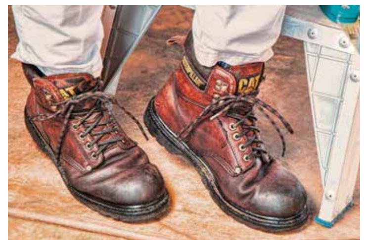
La prochaine conférence-rencontre de Pro Senectute est consacrée aux douloureux des mains et des pieds

Sous la bannière Viellir en forme , Pro Senectute Arc Jurassien propose une rencontre très intéressante et gratuite, le jeudi 15 septembre de 14h à 16h, qui sera centrée sur nos extrémités.