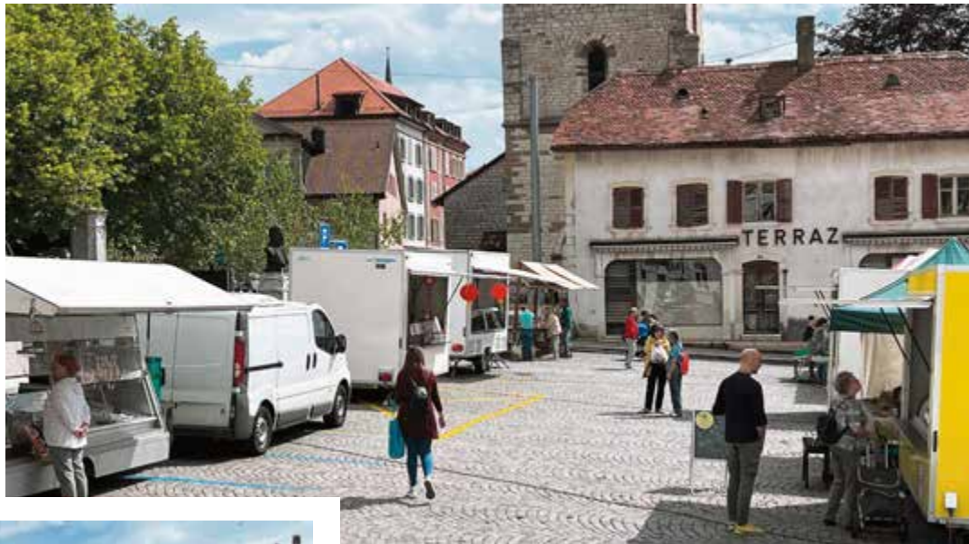
Jusqu'à huit commerçants occupent la Place du Marché le vendredi matin

Alors que la météo estivale joue les prolongations et que les vacances sont derrière nous, le moment est venu de faire le point sur les marchands présents aux marchés hebdomadaires.