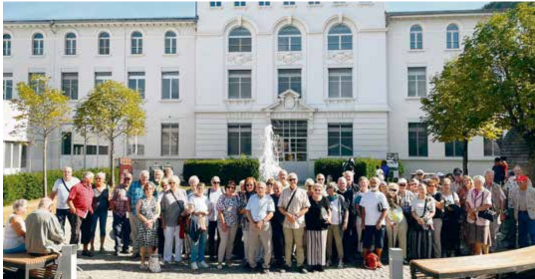
Les participants réunis devant le but de leur visite matinale