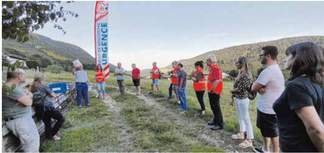
Les conseils municipaux de Sauge et de Romont

Outre des informations, le point de rencontre d'urgence peut, si nécessaire, proposer des distributions de nourriture, d'eau potable ou d'autres biens d'usage courant, voire la fourniture d'une alimentation électrique de secours. Pour les personnes