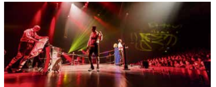
Catch-Impro, un match d'improvisation entre 2 comédiens suisses et 2 québécois

thème Les Multiples , les œuvres seront des gravures, estampes, sérigraphies, impressions 3D, etc. Quelle que soit la technique utilisée, le CCL s'intéresse aux créations réalisées dans la perspective de pouvoir être reproduites et d'exister en plusieurs exemplaires. Les candidatures sont ouvertes à tous, sur la base d'un portfolio à envoyer ou à déposer au CCL. Les sélections des dossiers se feront selon les critères suivants: la démarche individuelle et cohérente, la qualité technique et l'originalité. Le délai de dépôt des dossiers est le 31 octobre 2022.