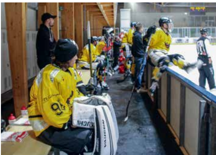
Un banc trop restreint pour avoir du répondant durant soixante minutes

Mercredi 13 octobre 1 er l. 20h15: Delémont-Vallée – St-Imier