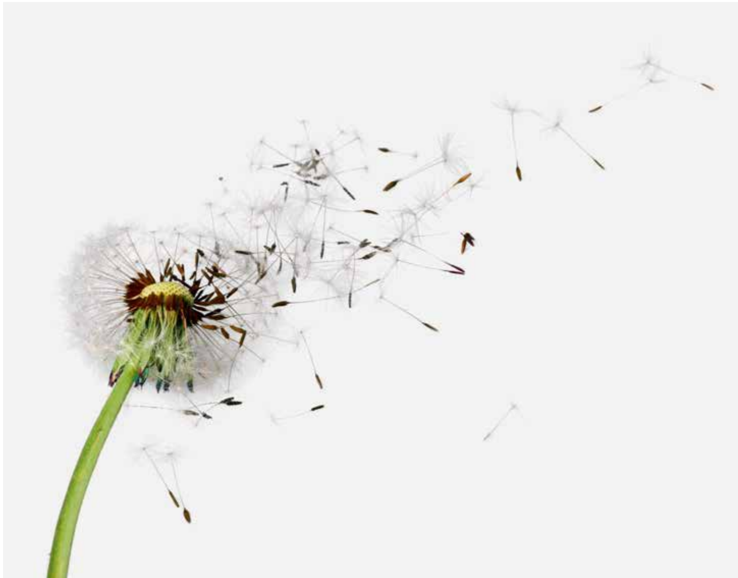
La mémoire s'en va? Le cerveau perd de sa vivacité? Parlons-en!

Est-il possible d'entretenir son cerveau, de faire travailler sa mémoire et sa vivacité d'esprit, afin d'éviter les attaques de la démence, ou du moins de les retarder et de les atténuer?