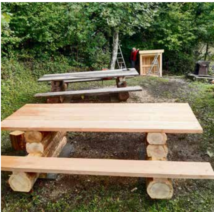
La place de pique-nique de Piémont est désormais très accueillante et fort bien équipée

Ainsi qu'il l'avait annoncé dans la dernière en date de ses chroniques, le GR 2608 a terminé les travaux de réfection et d'aménagement de la place de pique-nique de Piémont.