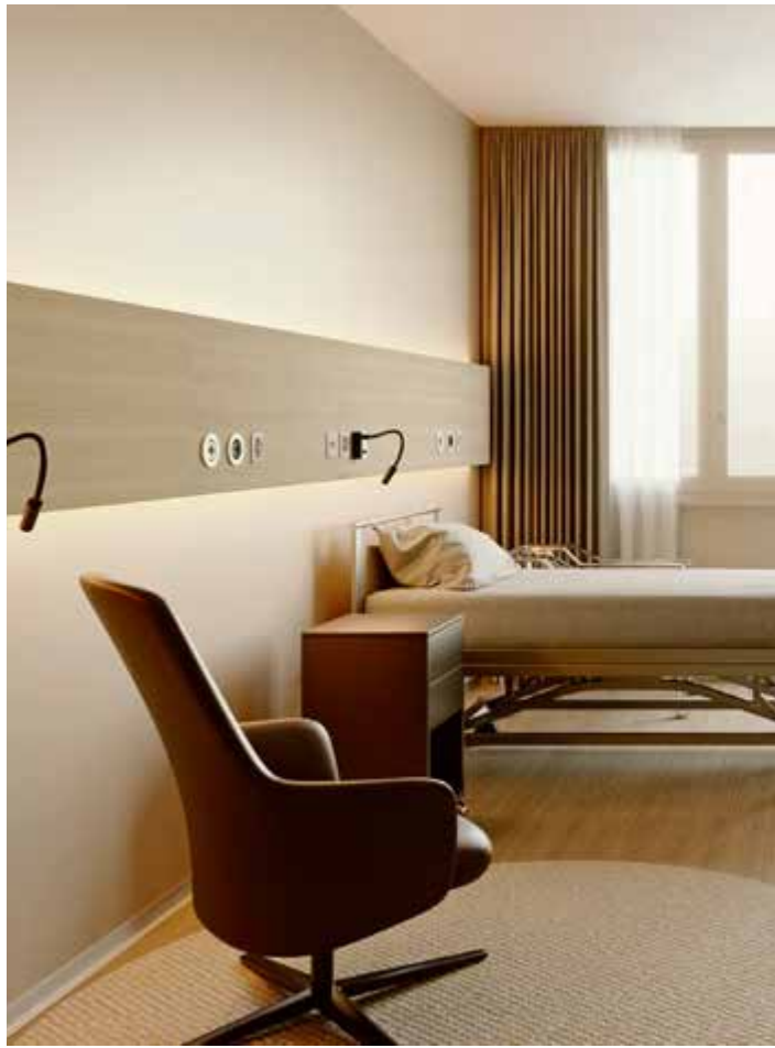
activités à haute valeur ajoutée. Comptant près de 1200 collaborateurs, l'HJB couvre les

Établissement de proximité, bien ancré dans sa région et s'appuyant sur des compétences multidisciplinaires au service des patients, l'Hôpital du Jura bernois (HJB) offre des