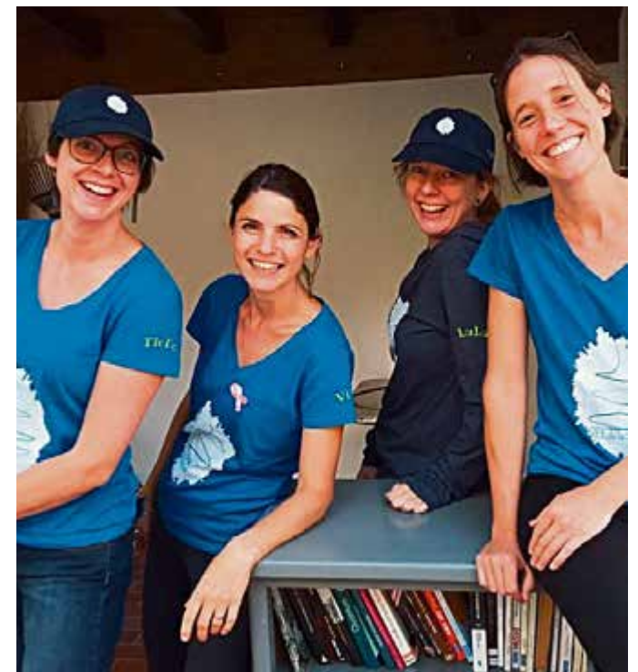
Notre joyeuse équipe du SEL de la Suze, qui pose devant leur boîte à livres installée à Cormoret

Vous avez envie d'être tenu au courant de nos prochaines activités ? Vous souhaitez devenir membre ? Vous êtes tout simplement curieux de