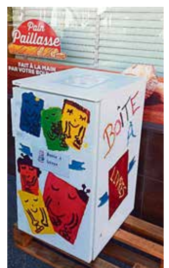
Leur plus récente boîte à livres, à Corgémont

Pour participer rien de plus simple : passez faire un tour dans l'une ou l'autre de leurs cabanes, et répondez à la question affichée en inscrivant vos coordonnées complètes au 079 732 78 25 (sms, Whatsapp, Signal). Les 10 gagnants tirés au sort remporteront un lot de produits confectionnés avec soin par notre équipe du SEL. Un prix spécial attendra la personne qui répondra à toutes les questions. Délai limite de participation : dimanche 31 octobre.