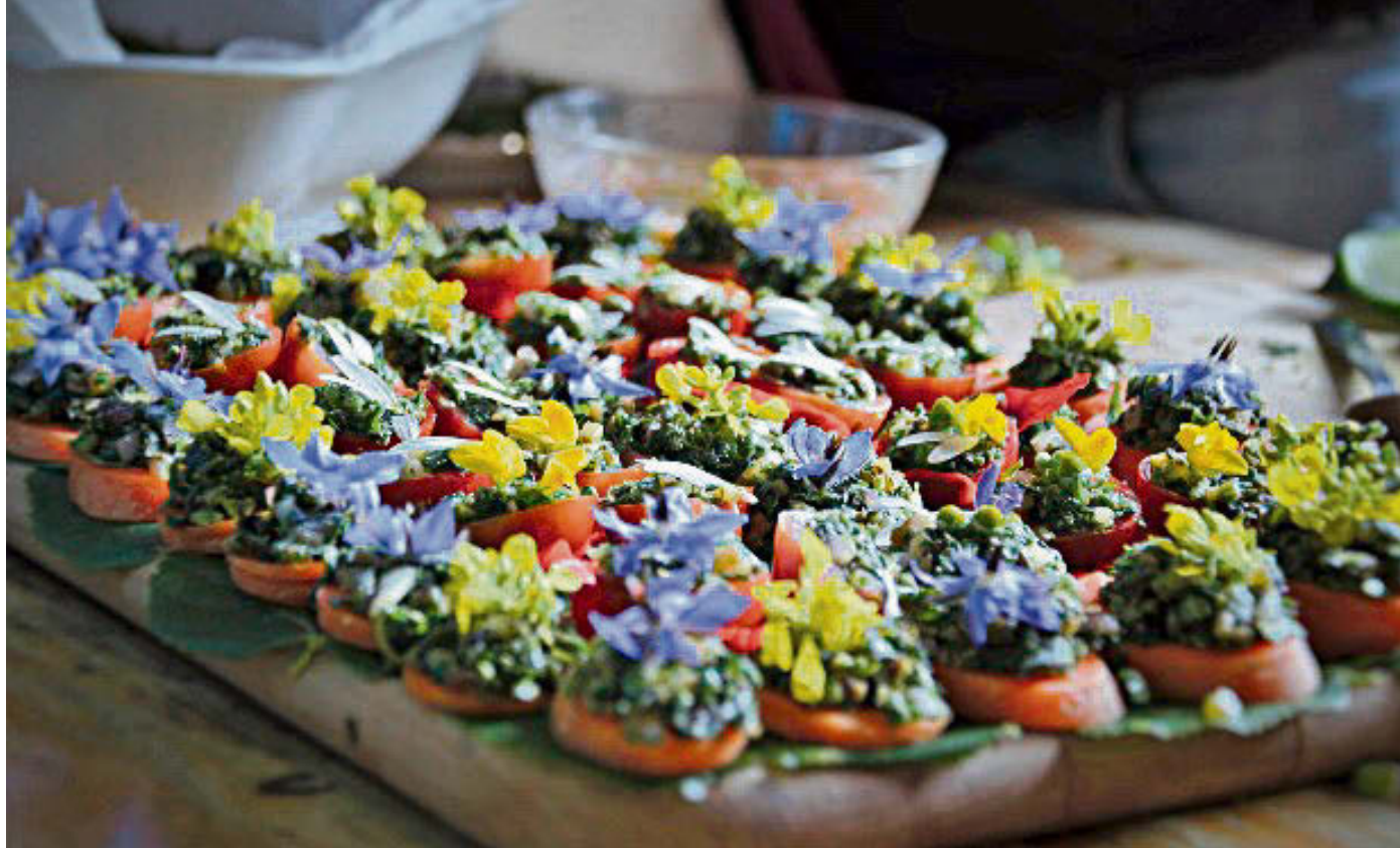
Le 16 octobre, on part à la cueillette de plantes sauvages comestibles pour apprendre à les apprêter.

Randonnée facile sur les chemins pédestres du Chasseral à la découverte des plantes médicinales typiques de la région. Pique-nique dans les pâturages boisés et présentation du travail de transformation de certaines