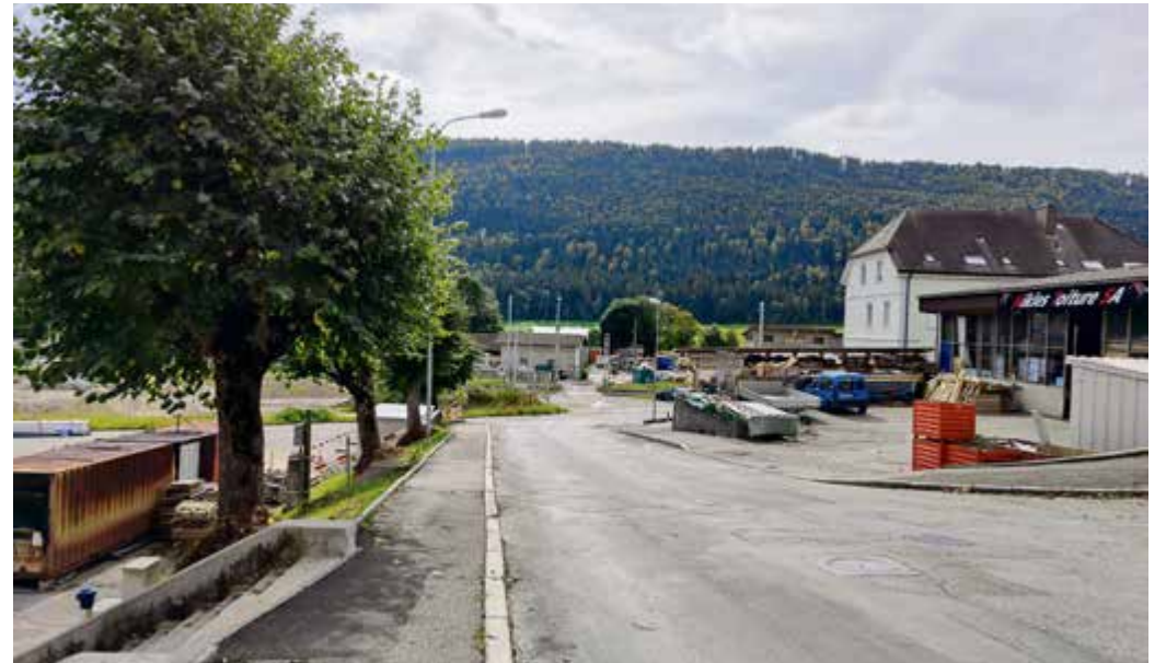
La rue de Chasseral avant le début des travaux

Dans un premier temps, les travaux se concentreront dans la partie aval. Ils concerneront l'accès à la Place des Abattoirs. Il est bien évident que ce dernier sera garanti en tout temps, afin de permettre au Service du feu d'intervenir. L'accès au passage à niveau et par conséquent aux Marnes-de-la-Coudre (sud des voies) sera également assuré.