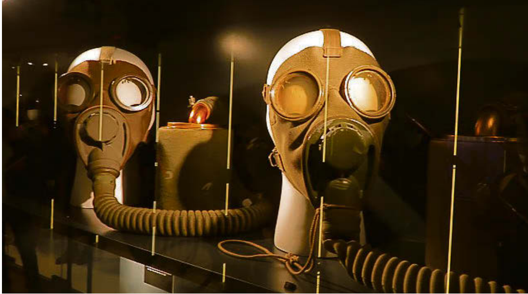
Un regard parfois un peu effrayant sur l'histoire de l'armement

Après une fermeture de quatre ans pour cause de rénovation, le Musée de Saint-Imier rouvre ses portes, avec une nouvelle dimension militaire d'importance, grâce à son espace réservé à l'histoire des troupes jurassiennes. L'inauguration du musée a eu lieu le 30 septembre, en grande pompe, devant un parterre d'une centaine d'invités qui a écouté les discours du conseiller-exécutif bernois Pierre Alain Schnegg et du ministre jurassien Martial Courtet notamment.