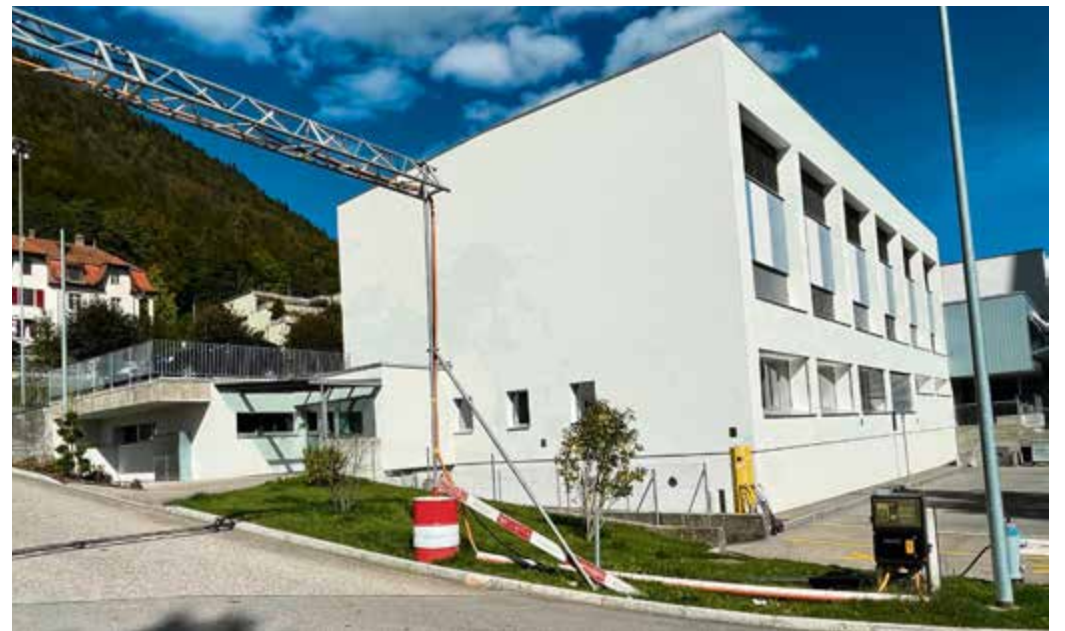
L'Espace Beau-Site, dont l'entrée est située à gauche sur la photo, accueillera l'équipe de vaccination mobile de l'Hôpital du Jura bernois

Enfin, il faut savoir que l'équipe mobile de l'Hôpital