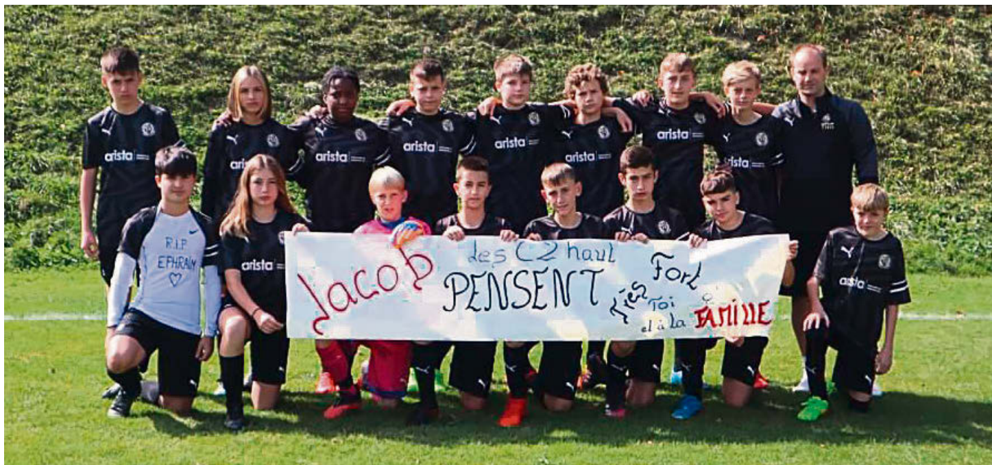
Les juniors D2h rendent hommage au frère d'un de nos juniors, décédé dans l'incendie de Saint-Imier

Septième match du tour d'automne pour les juniors E Seferovic qui recevaient le FC Tavannes/Tramelan B. Sur une très belle phase de jeu, premier but des joueurs locaux, un score qui ne bouge pas jusqu'à la fin du premier tiers. Lors du deuxième tiers, très animé, les visiteurs égalisent sur corner. Le