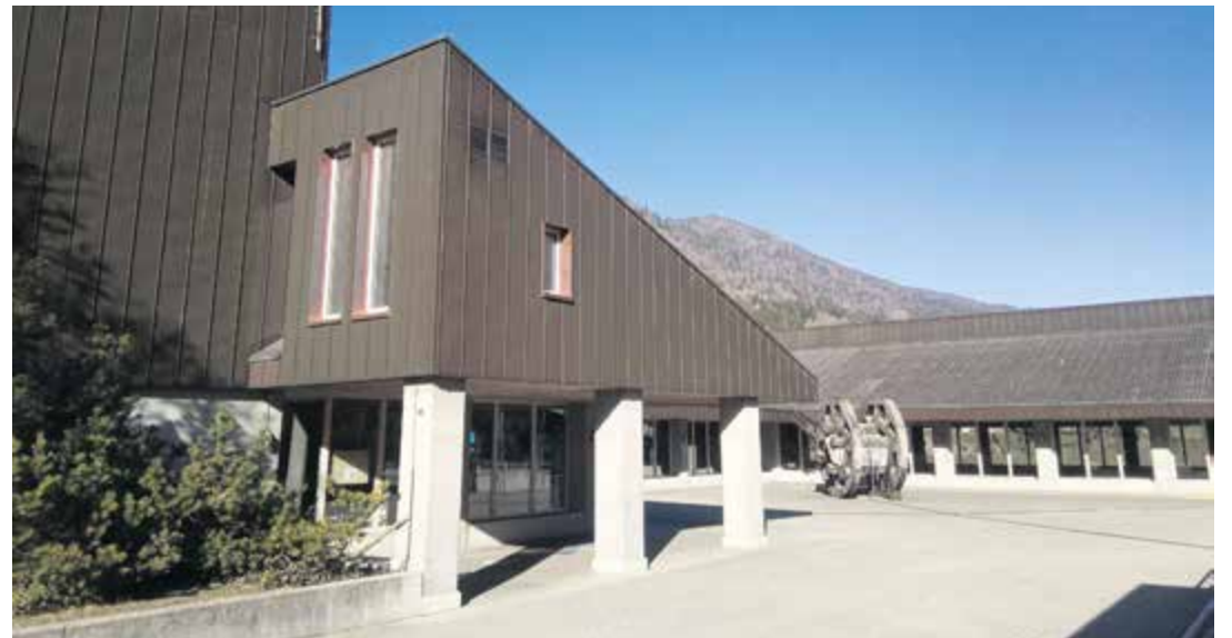
Le Centre communal et l'école de Péry sont trop énergivores

Une fois cette première étude terminée, une entreprise spécialisée sera très probablement mandatée pour élaborer un concept financier lié à ce patrimoine immobilier. | cm