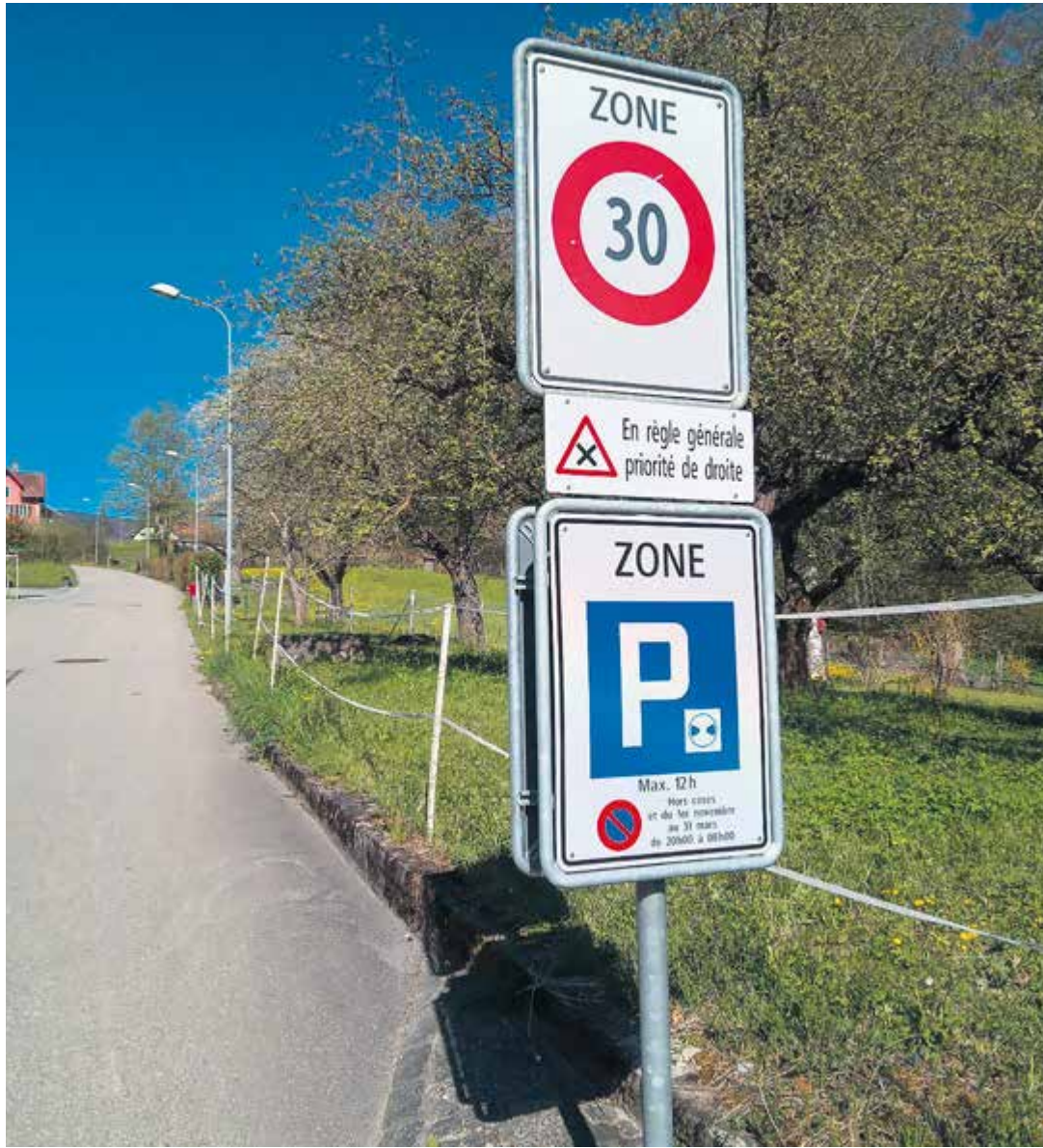
Les rues de Péry sont limitées à 30 km/h

Le danger subit une nouvelle aggravation sur certaines rues communales, où il est constaté, ce printemps en particulier, une forte recrudescence des excès de vitesse. Les véhicules motorisés en question pourraient causer de tragiques accidents, dans des secteurs où les usagers les plus fragiles, enfants, piétons en général et deux-roues, sont habitués à un trafic à vitesse modérée; au demeurant, pour des questions cumulées de gabarit, de visibilité et de mixité du trafic, les chaussées concernées ne permettent pas de rouler vite en toute sécurité.