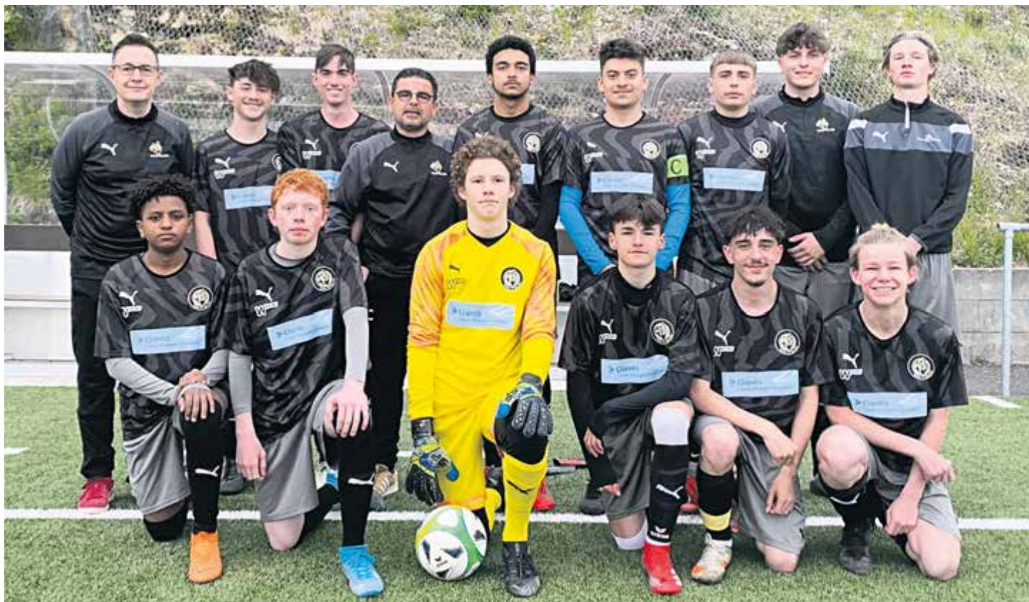
Les juniors B1 du Team Vallon/Sonvilier

Après avoir appris la veille la tenue de ce match, les juniors C1 ont livré une magnifique première période puisque le score était de 1 partout après 30 minutes. L'équipe d'Audax/Friul parvenait toutefois à profiter de deux erreurs d'inattention pour atteindre la mi-temps sur la marque de 3-1. Handicapée par un effectif réduit en raison de nombreuses absences, l'équipe vallonnaise va finir par s'incliner lourdement 8-1, un score sévère et trompeur qui ne