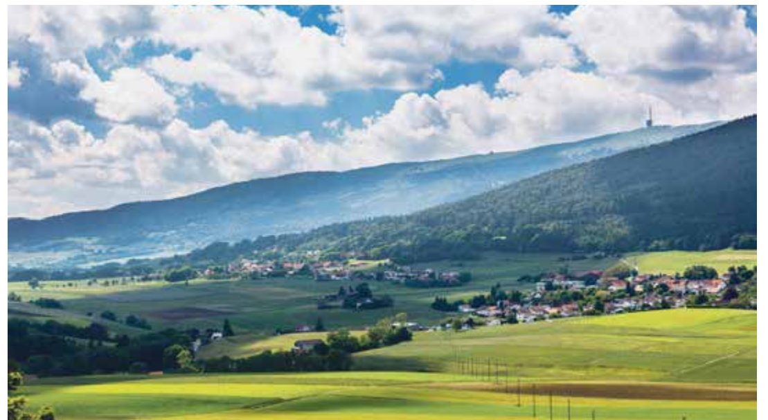
Plateau de Diesse

Le Parc Chasseral remercie d'ores et déjà les habitants