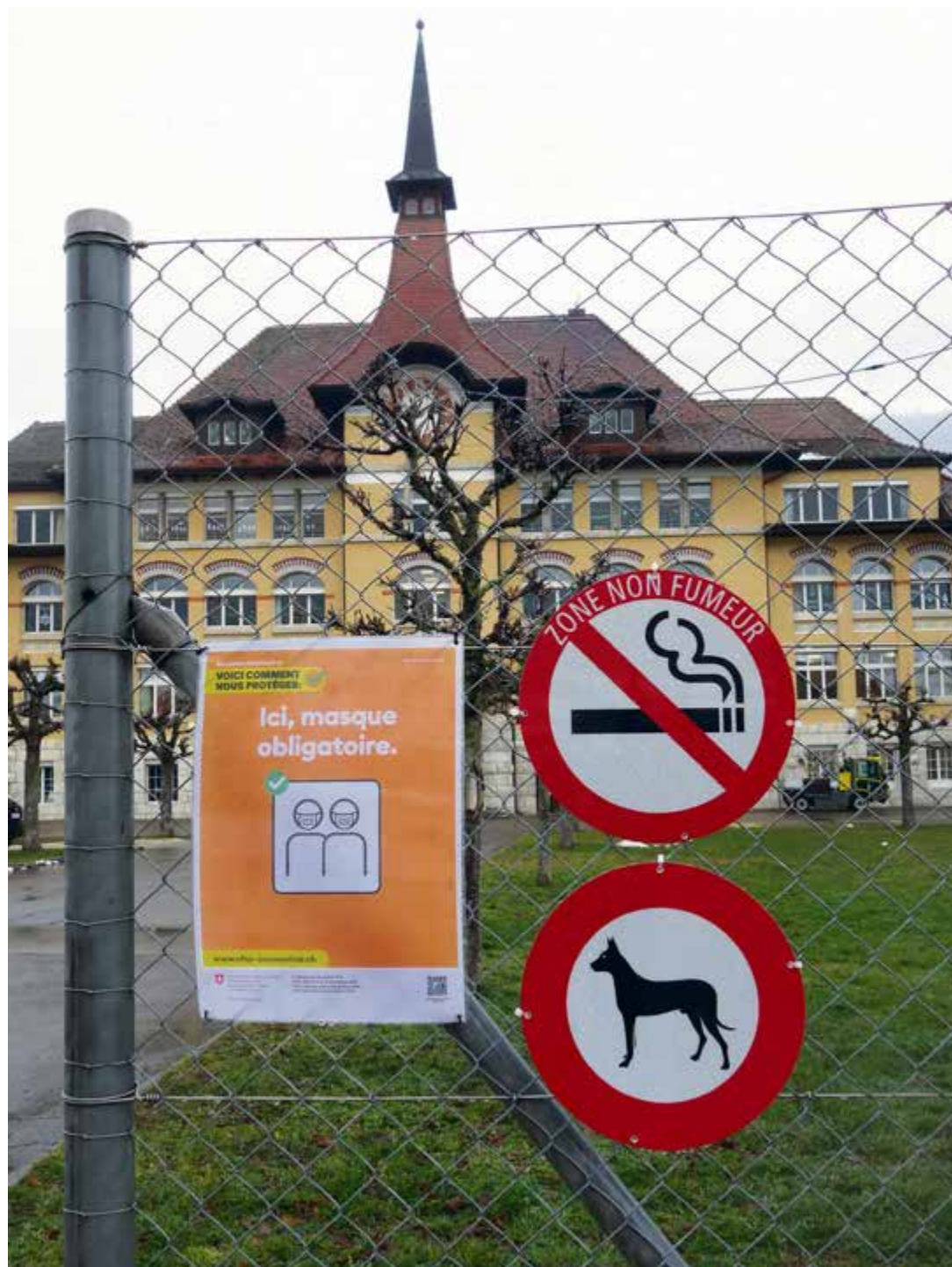
Ainsi que le stipulent les panneaux installés dans le préau, les alentours du collège sont désormais non-fumeur (sauf dans la zone est, munie d'un cendrier et toute proche des tables de ping-pong) et interdits aux chiens