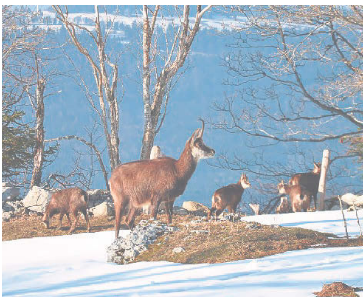
Les chamois, comme les autres mammifères ou les oiseaux, sont fragilisés par la neige, qui rend les déplacements et la recherche de nourriture plus difficile

En plus de mesures concernant les accès à certains de ces lieux de détente, coordonnées avec les communes concernées, le Parc Chasseral va installer courant décembre des bâches de sensibilisation pour relayer ces informations, qui relaient la campagne nationale Respecter c'est protéger aux départs des itinéraires de randonnée hivernale.