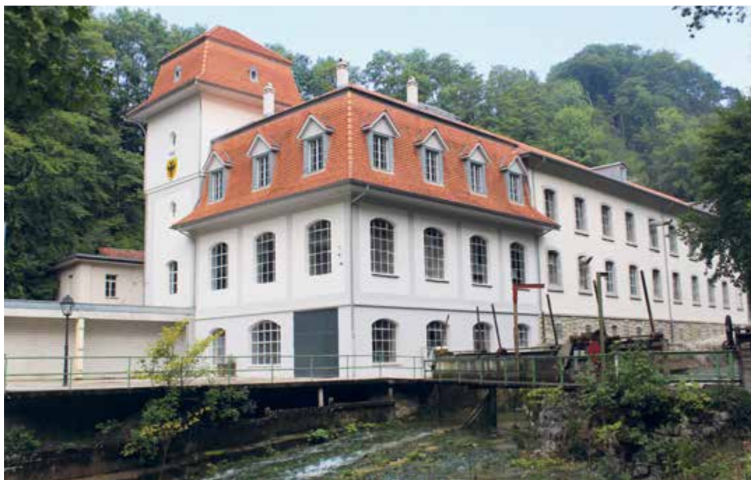
Les votants du 13 décembre ont très clairement approuvé le contrat liant la commune au Parc régional grâce auquel, avec le soutien de Vigier, les Jardins Musicaux offrent chaque été depuis 2017 une animation culturelle dans l'ancienne usine de pâte de bois de Rondchâtel

L'Exécutif local remercie les électeurs qui ont pris la peine