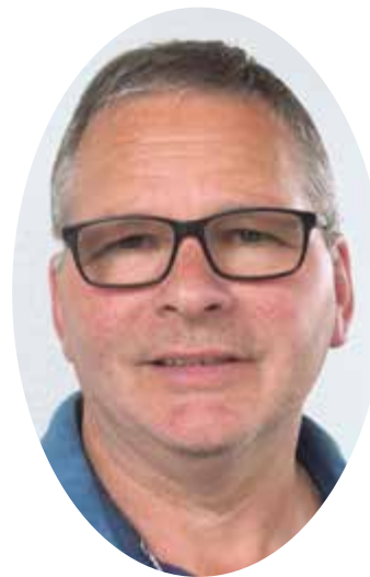
Bonne et heureuse année 2021. | étienne klopfenstein

Au plaisir de vous rencontrer bientôt, prenez soin de vous.