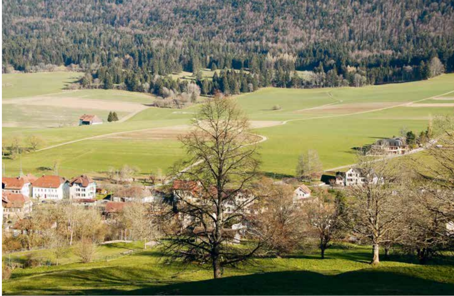
Les prochains exercices financiers induiront une nette diminution de la fortune communale, mais la tendance devrait s'inverser dès 2026

Les travaux importants seront entrepris sur le tronçon circulant entre la ferme de Raphaël