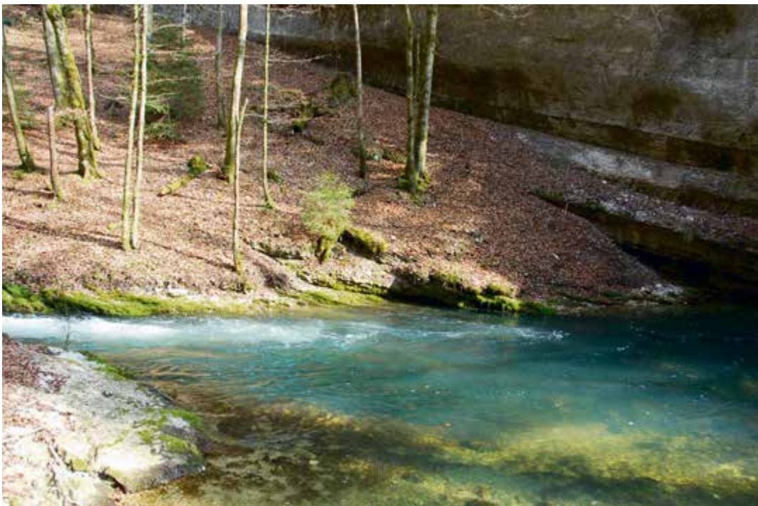
La commune a renouvelé son contrat avec le Parc Chasseral, qui contribue notamment à mettre en valeur ses magnifiques paysages

A la population in globo, les présidents du Législatif et de l'Exécutif locaux souhaitaient de vivre une année 2021 plus agréable que 2020, tout en exhortant chacun à faire preuve de la plus grande prudence durant les Fêtes. Il faut absolument éviter une contamination que nos services de santé ne supporteraient plus. | cm