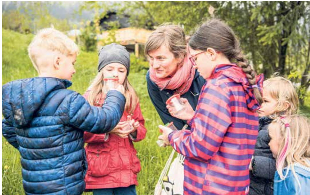
Dans l'animation Des arbres pleins de vie, les élèves recherchent et observent les petites bêtes dans les cavités des vieux arbres et dans le bois mort.

Entre juin et fin octobre, près de 1400 élèves de 76 classes ont participé aux animations école du Parc Chasseral. Fortement sollicité par les enseignants de la région durant cette année marquée par le covid-19, le Parc a tout fait pour permettre aux classes de la 1 re à la 11 e année HarmoS de partir en course d'école dans la nature.