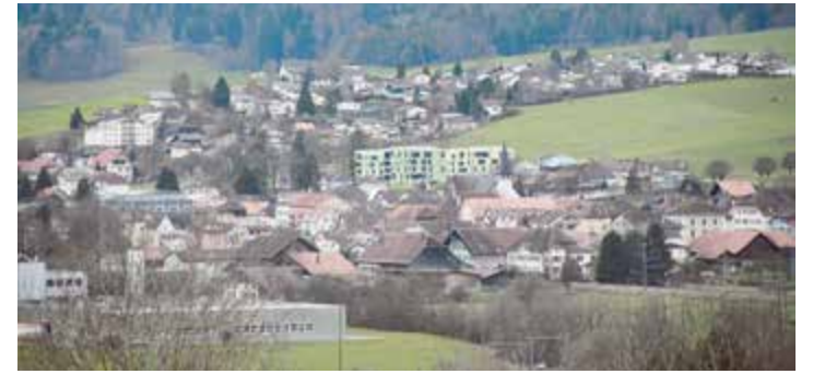
Il fait bon vivre dans notre commune, l'UCI cantonale le confirme dans son classement des communes

Au dernier classement en date de l'Union du commerce et de l'industrie (UCI), notre localité obtient le sixième rang des communes du Jura bernois, derrière, dans l'ordre, Moutier, Saint-Imier, Sonceboz-Sombeval, Tramelan et Tavannes.