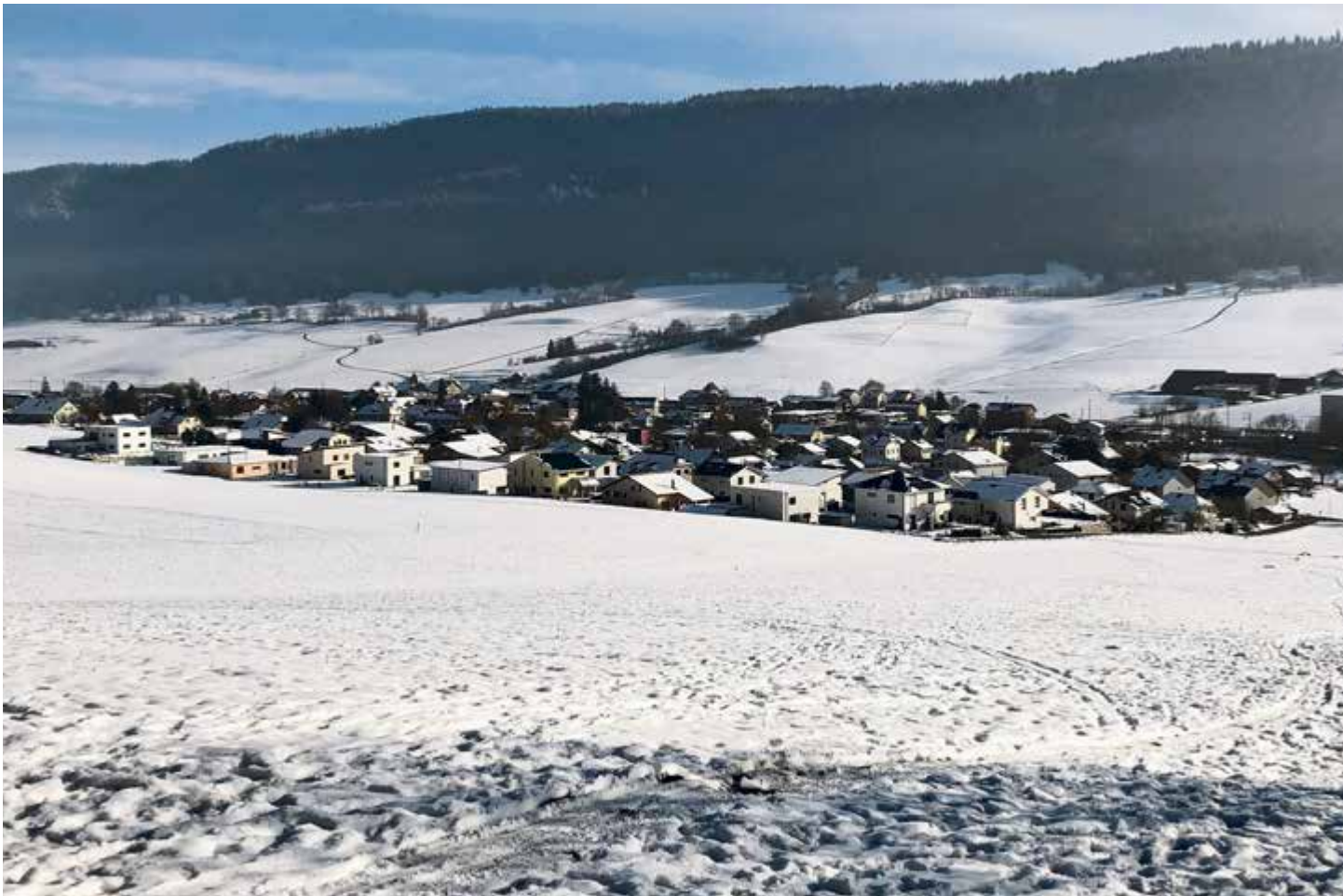
Avec un brin de nostalgie, retour en image sur le bref épisode blanc de cette fin d'année...