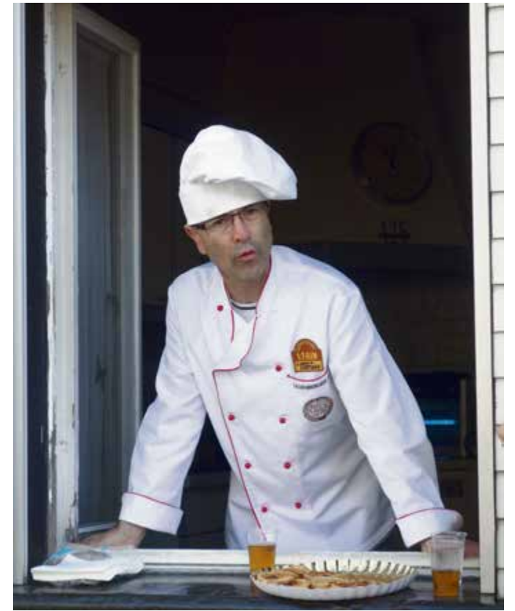
L'assemblée a approuvé comme un seul homme le contrat liant la commune avec le Parc Chasseral, qui propose notamment, sur notre territoire, son excellente visite-spectacle intitulée Le salaire de la Suze, avec la participation du boulanger local