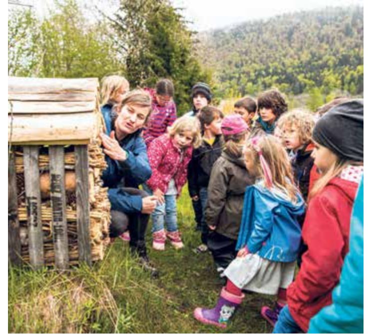
Les élèves découvrent l'importance des insectes puis construisent des hôtels à insectes afin de leur proposer un habitat durant l'animation La biodiversité et moi.