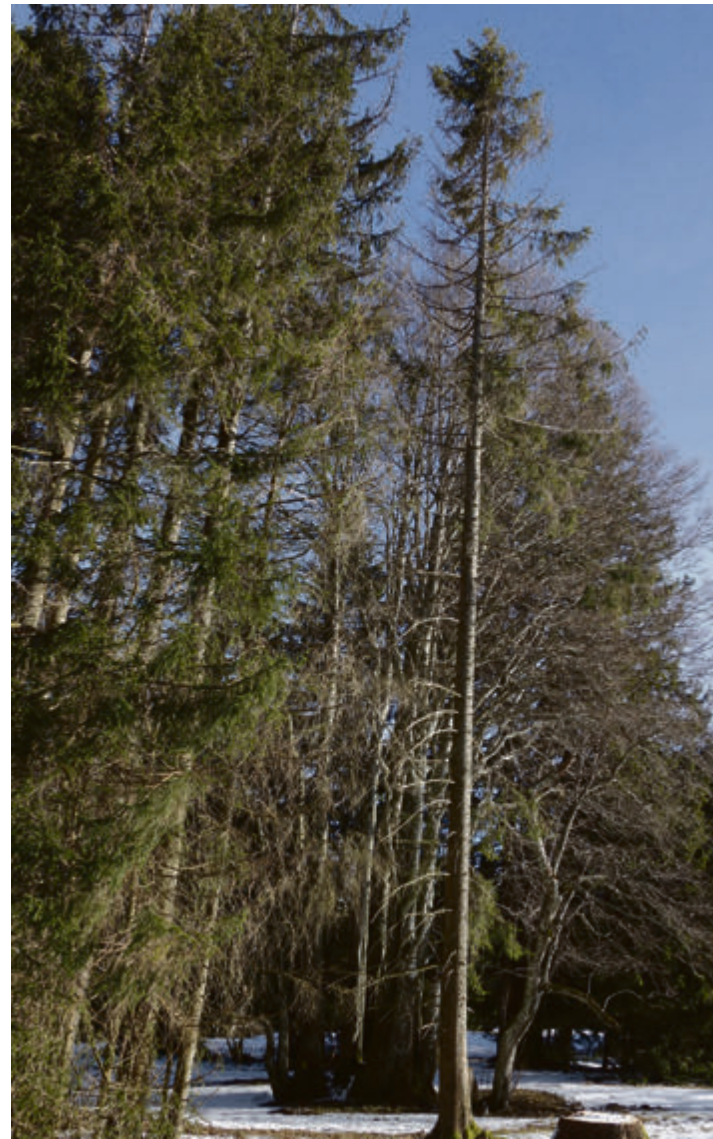
Le mauvais état des arbres n'est pas toujours aussi évident, à l'œil, mais les dangers sont grands et leurs propriétaires responsables

La Municipalité rend les propriétaires attentifs aux risques encourus et leur précise qu'en cas de doute, ils peuvent demander à la commune de procéder à une expertise. | cm