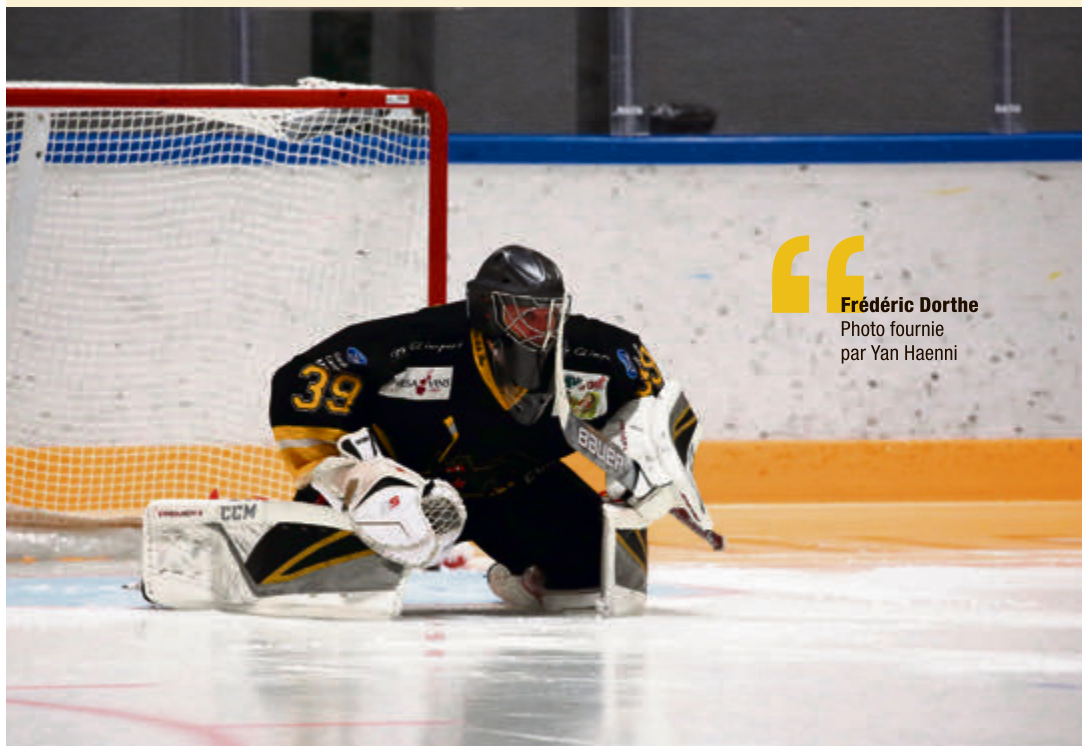
Frédéric Dorthe

1 re I. 18h : St-Imier – Uni-Neuchâtel ou Franches-Montagnes, ½ finale, acte IV