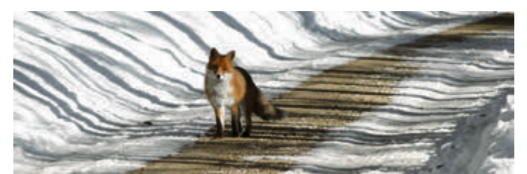
Belle rencontre avec un renard