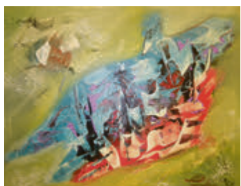
Une des œuvres exposées à l'hôpital du Jura bernois