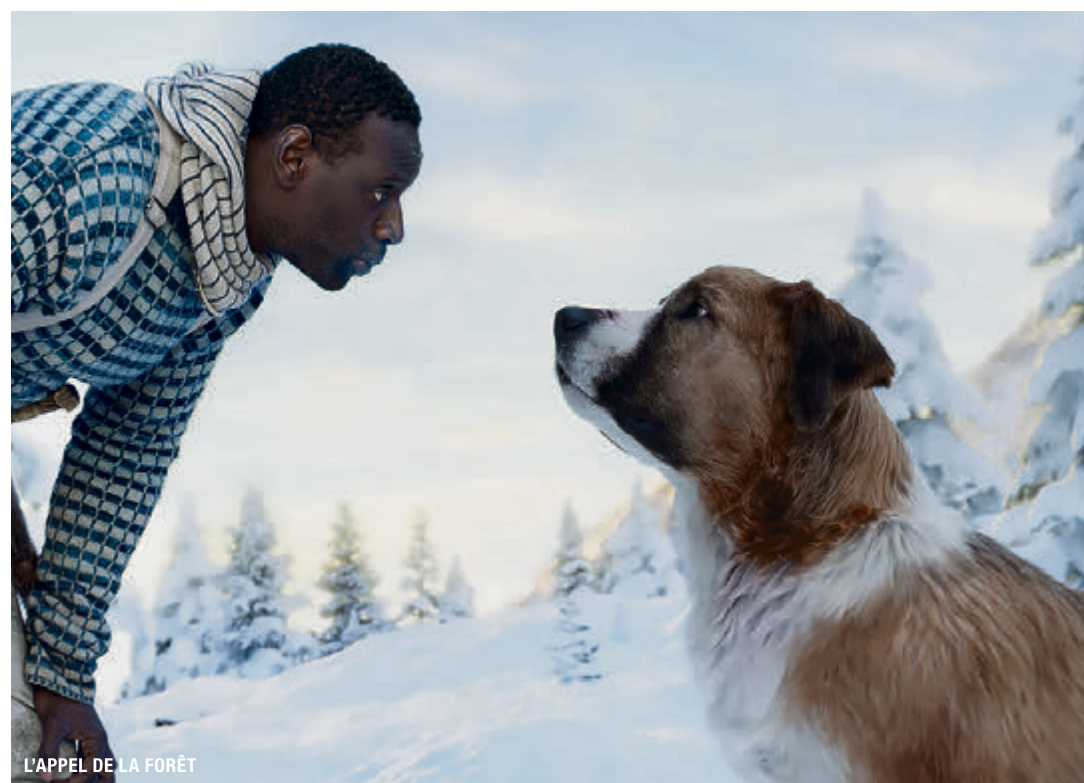
L'APPEL DE LA FORÊT