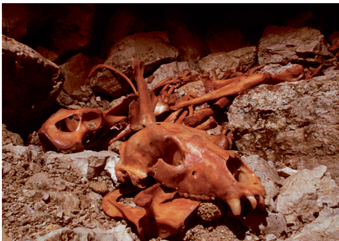
Ours brun ( Ursus Arctos ), Gouffre Narcoleptique (VD)

En travaux dans le cadre du réaménagement de son exposition permanente, le Musée de