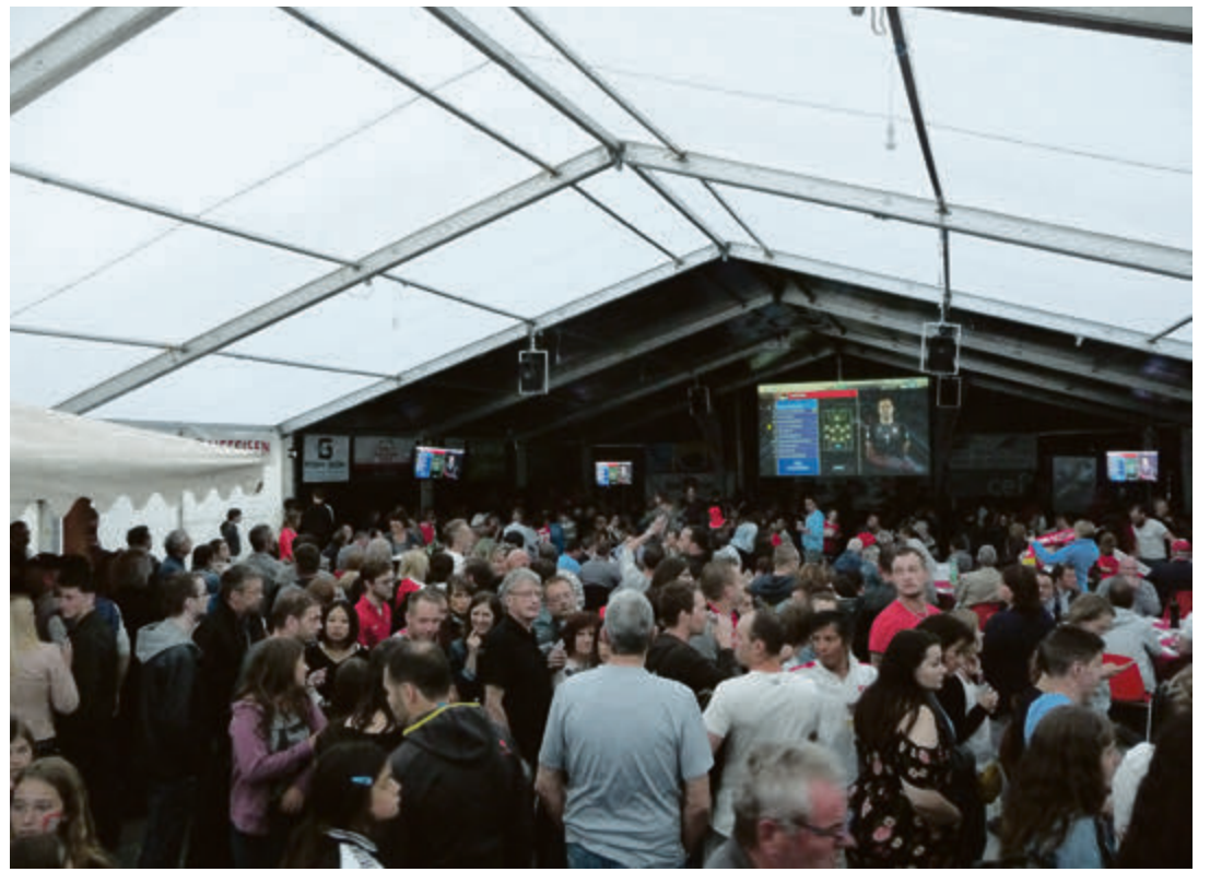
Avec la qualification de la Suisse pour la phase finale de l'Euro 2020, la future fanzone promet quelques belles affluences, comme ici lors du match du Mondial 2018 contre la Serbie

Les associations ou sociétés intéressées doivent s'annoncer sans tarder auprès des organisateurs (tél. 079 611 61 34).