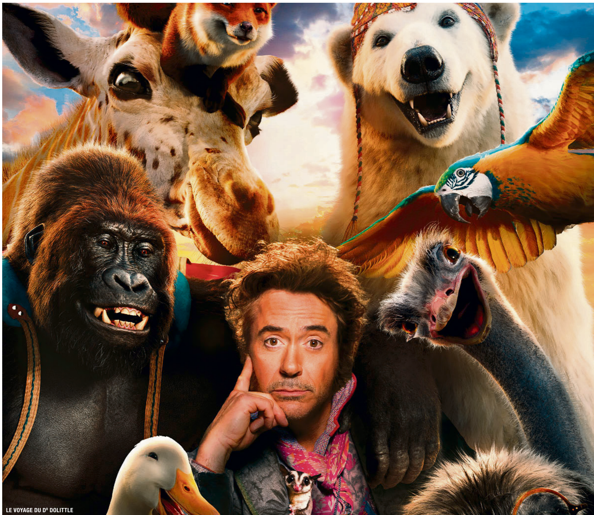
LE VOYAGE DU D e DOLITTLE

de Jan Komasa, avec Bartosz Bielenia, Eliza Rycembel. Daniel, 20 ans, se découvre une vocation spirituelle dans un centre de détention pour la jeunesse. Le crime qu'il a commis l'empêche d'accéder aux études de séminariste. En VO s.-t. 16 ans. Durée 1 h 55.