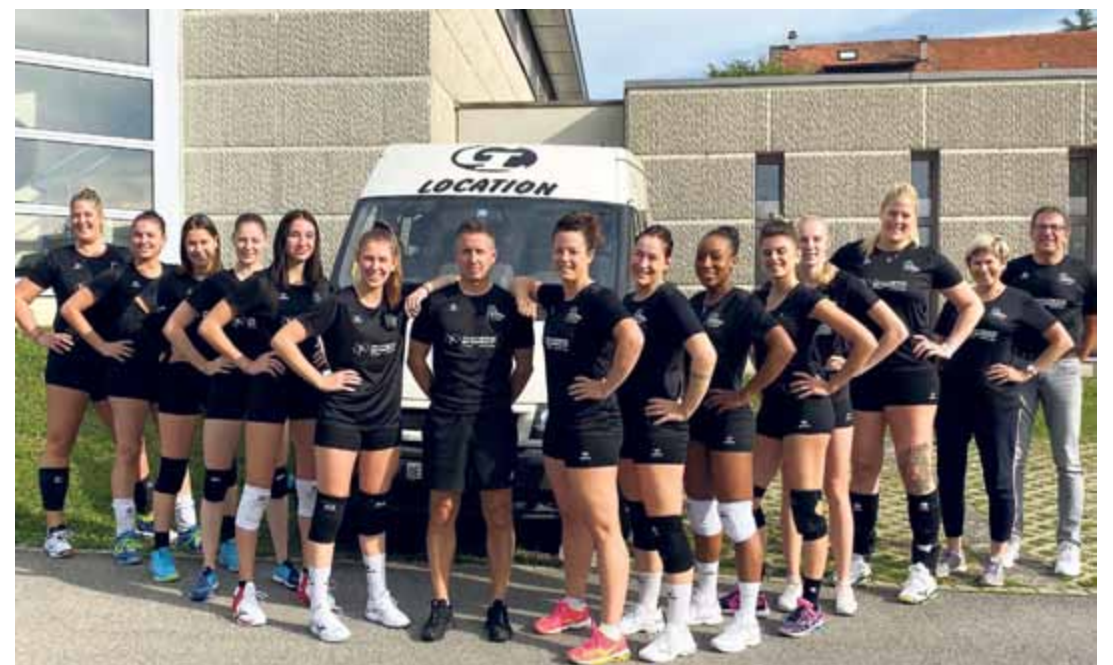
L'équipe phalange n'a pas fait le poids à Cheseaux, mais elle n'en perd pas sa motivation et remercie ses sponsors

Les joueuses et l'encadrement de l'équipe de D1 tiennent à remercier le Fitness Energy, qui leur a offert un jeu de maillots d'échauffement, ainsi que GL Import, qui leur prête un véhicule très apprécié lors de leurs déplacements. | vp