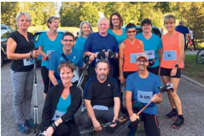
Les membres du CCT avant le départ de la course de Prêles

Les membres du CCT ont participé tout au long de la saison à différentes courses, en voici une rétrospective et les résultats.