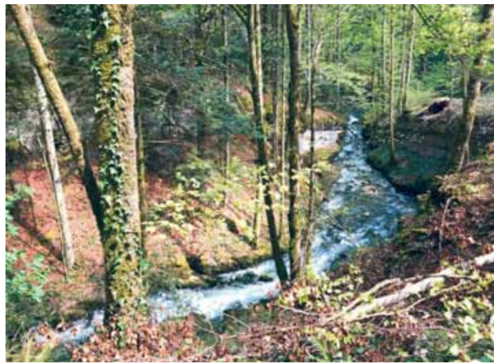
A l'instar d'autres sources dans le Vallon, celle de la Doux est concernée par l'essai de coloration

Une étude environnementale conduira la semaine prochaine à un essai de coloration des eaux dans la région de La Chaux-de-Fonds. Dans le vallon de Saint-Imier, plusieurs sources seront surveillées de près.