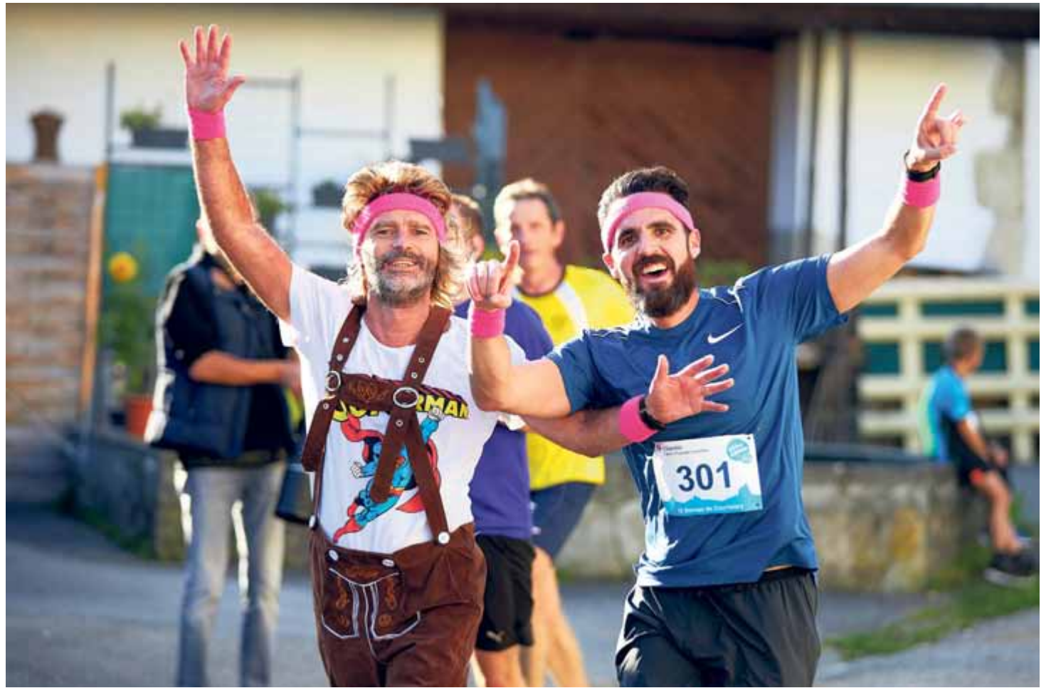
Les beaux déguisements des 10 Bornes

Alors un grand merci à tous nos bénévoles, à nos sponsors, au public, aux coureurs et aux fêtards qui ont su rendre cette 50 e inoubliable.