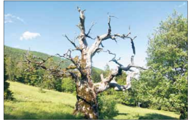
Un arbre sec en pâturage boisé, comme ce très vieux chêne, constitue un habitat recherché pour de très nombreuses espèces de coléoptères

Sept de ces espèces sont considérées au niveau européen comme des « reliques de forêts primaires », un gage de rareté. L'une d'entre elles (Anitys rubens) n'avait jusqu'à présent jamais été observée en Suisse. Une véritable petite forêt vierge se cache donc au-dessus d'Or-