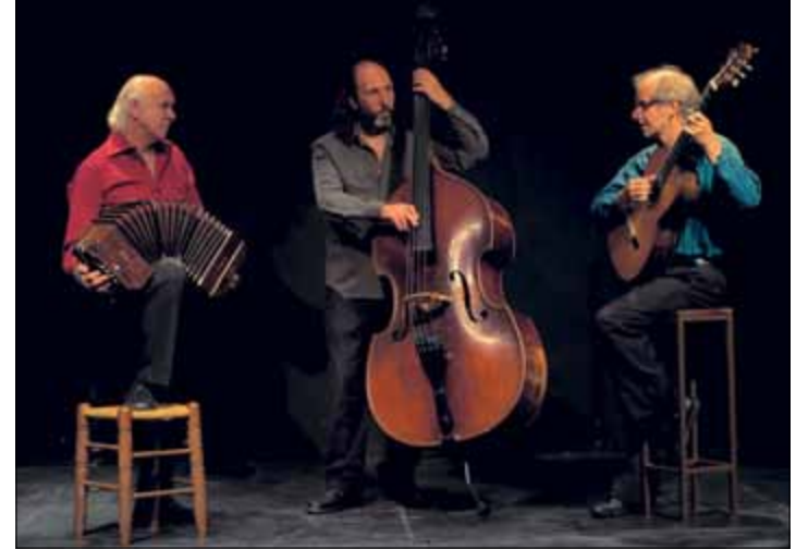
Bal(l)ade La Neuveville trio esquina