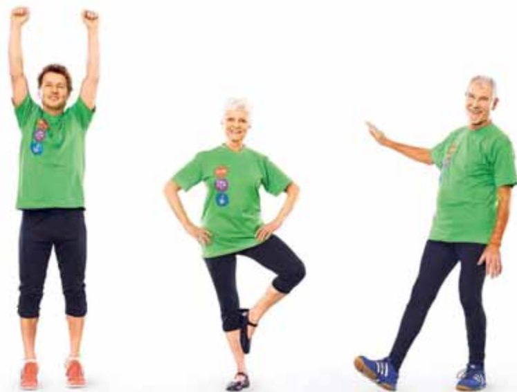
De nombreux exercices adaptés sont conseillés pour maintenir ou retrouver son équilibre

Mercredi 11 septembre 14h-16h Salle communale, Courtelary Inscr. prosenectute.tavannes@ne.ch ou 032 886 83 80 jusqu'au 4 septembre Entrée libre Egalement le jeudi 12 septembre à La Neuveville, même horaire, place du Marché 3