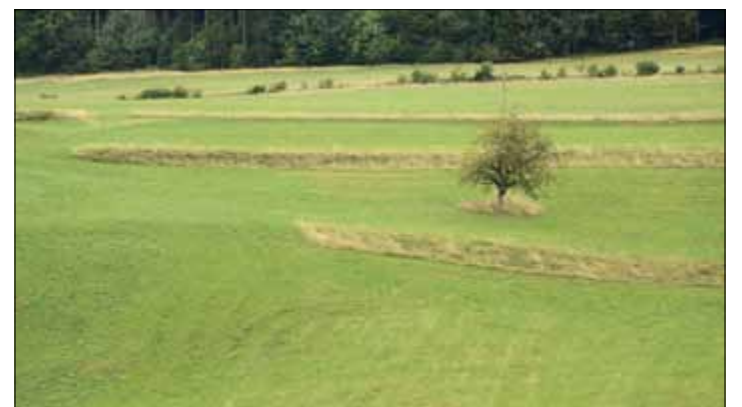
Dans les prairies concernées, dix pour-cent de la surface est épargnée par les machines au profit de la biodiversité

les chambres d'agriculture et d'autres organisations.