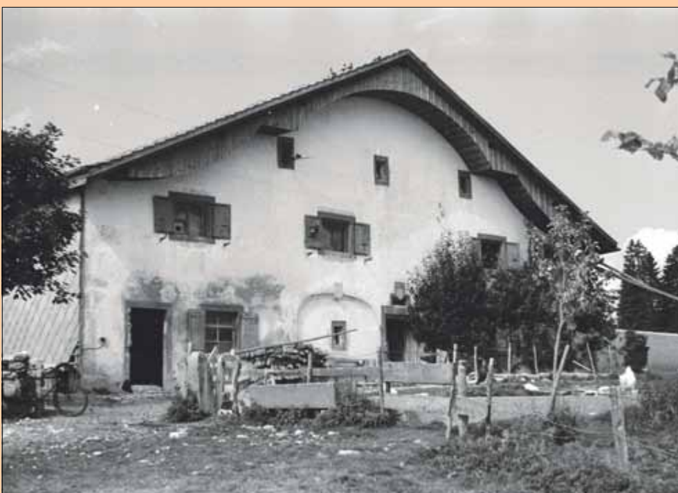
La Combe du Pélu, La Ferrière, vers 1945