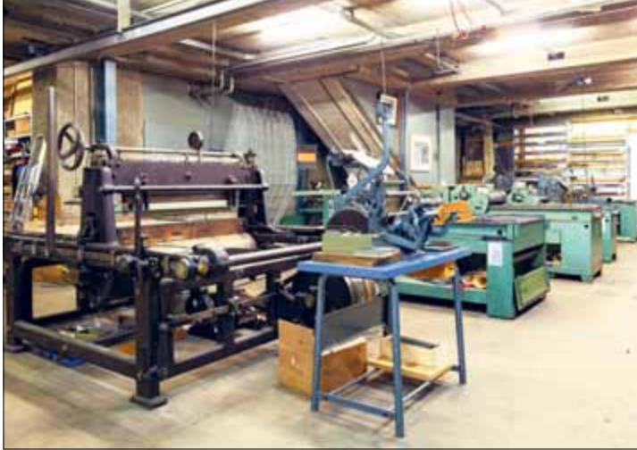
Bal(l)ade Bienne officina helvetica GionaMottura

Du 17 août au 1 er septembre, voici revenu le temps de Bal(l)ades... Pour la neuvième année consécutive, le Festival Les Jardins Musicaux et le Parc régional Chasseral organisent des moments culturels uniques composés de découvertes patrimoniales insolites et de concerts ou spectacles sur tout le territoire du Parc. Des billets sont à gagner sur www.parcchasseral.ch jusqu'au 12 août.