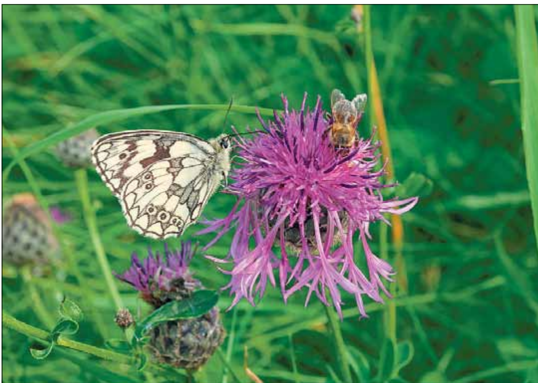
De nombreuses espèces d'insectes profitent de cette mesure volontaire des agriculteurs, comme ce papillon demi-deuil posé sur une scabieuse

Pas de répit en été pour les agriculteurs. C'est la saison, importante, des foins et des regains. Le fourrage servira de nourriture pour le bétail, surtout durant la mauvaise saison. Ici et là, de petites surfaces d'herbes hautes restent pourtant en place. Ces bandes refuge sont un acte volontaire des agriculteurs en faveur de la nature. Elles jouent un rôle important pour de nombreux insectes et certains petits mammifères.