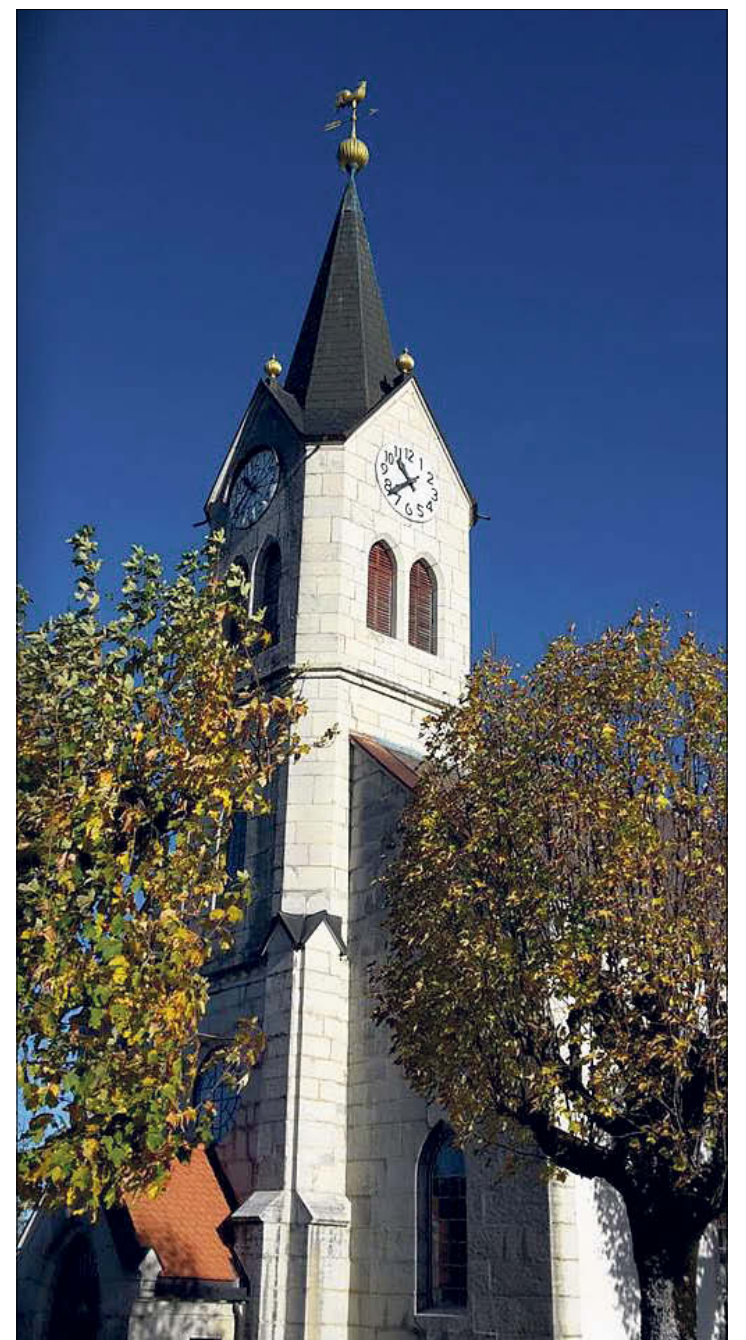
Paroisse réformée de Villeret

Plus d'informations: jw.org (site officiel gratuit)