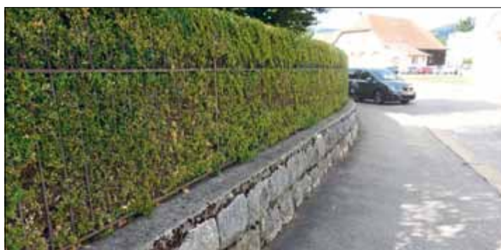
Les végétaux bordant les rues communales ne doivent gêner ni le passage ni la visibilité

agricoles et arbres qui ne sont pas à haute tige doivent respecter les prescriptions en matière de clôture, selon lesquelles leur hauteur ne peut pas dépasser 1,20 m, ni leur distance au bord de la chaussée, être inférieure à 50 cm. Si la végétation présente une hauteur plus grande, il est nécessaire de tailler jusqu'à la hauteur réglementaire. Cette disposition s'applique aussi à la végétation préexistante.