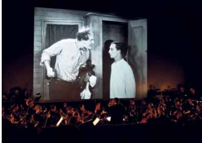
Bal(l)ade Bienne Buster Keaton © Alex Girod

– La femme-marteau , dimanche 18 août, Saint-Imier. Découverte (9h30) : une excursion dans les forêts de Saint-Imier animée par des biologistes et des exploitants forestiers pour découvrir les activités d'une Bourgeoisie dans le cadre d'une exploitation respectueuse de la biodiversité. Concert (11h30) : dans