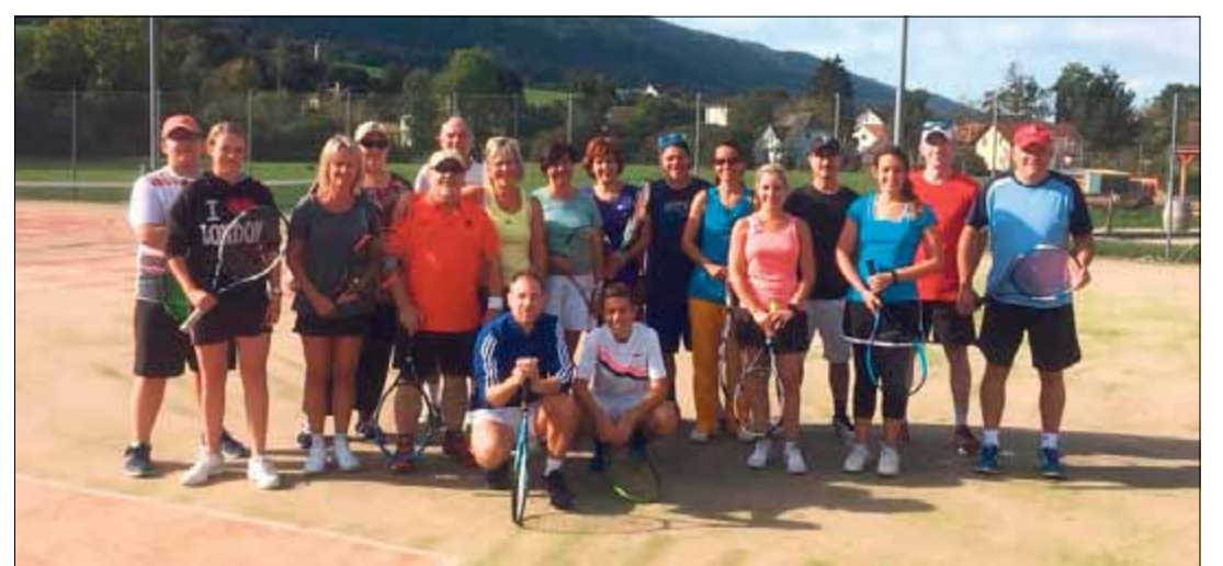
Tournoi des mordus