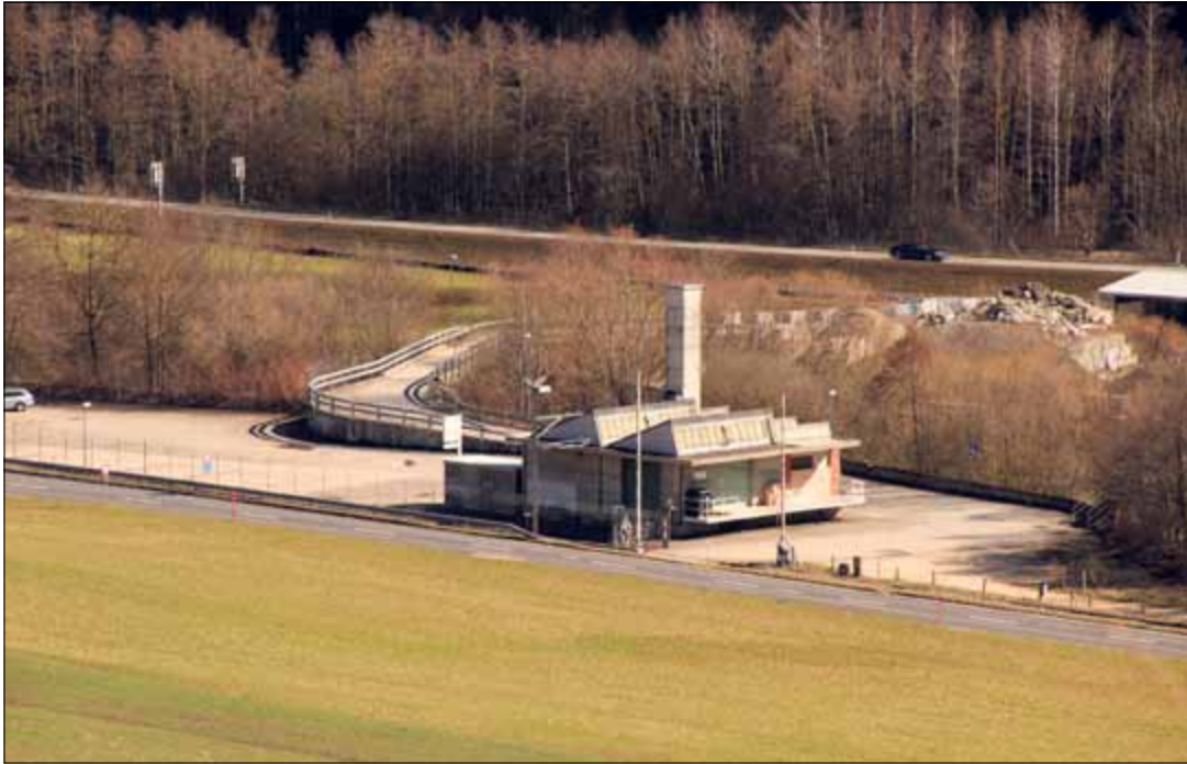
Réfection de tunnel oblige, le trafic motorisé du soir et du matin tôt augmentera provisoirement dans le secteur des Oeuches

Le Conseil municipal a avalisé la demande présentée par l'entreprise Marti travaux spéciaux SA, qui souhaitait utiliser son site des Oeuches pour stocker des machines et des matériaux engagés dans la réfection du premier tunnel de l'A16, ainsi que les modules préfabriqués abritant les vestiaires utilisés par les travailleurs. Ladite réfection va débuter lundi prochain le 25 mars, qui se déroulera exclu-