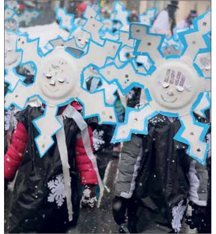
L'an dernier, de charmants flocons sur pieds, sous les derniers flocons de l'hiver

Suivra le Carnaval des enfants, batailles de confettis et ambiance de fête à la clé.