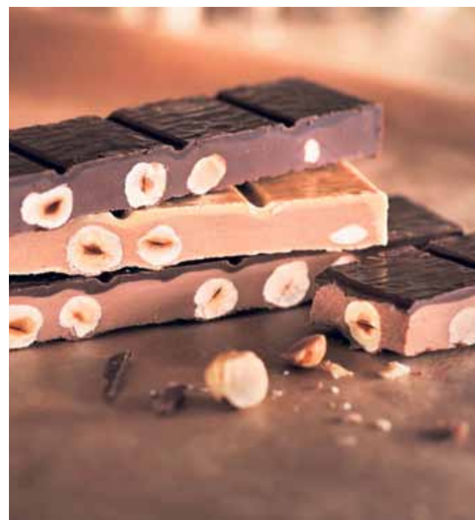
Confectionner son propre Ragusa chez Camille Bloch, une des expériences incontournables