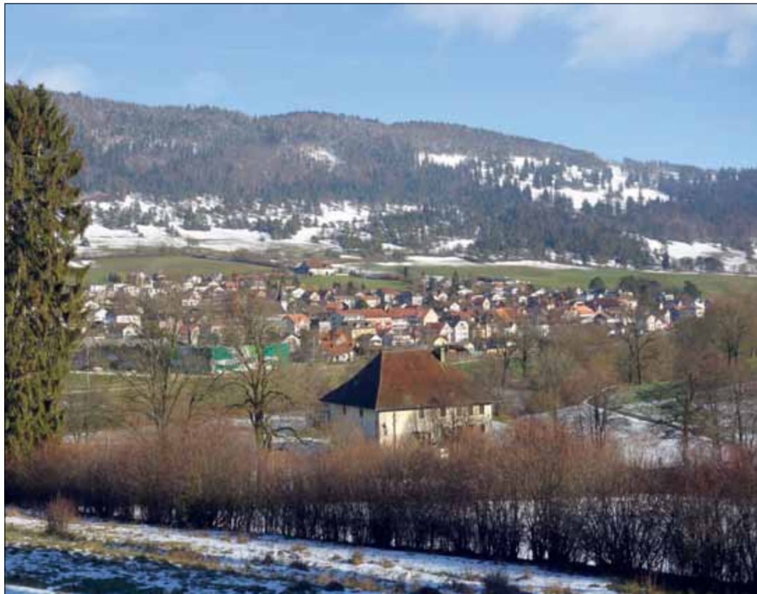
C'est le long de la Promenade du Moulin que le Cercle littéraire a choisi fin août prochain d'inaugurer une nouvelle forme de rendez-vous publics