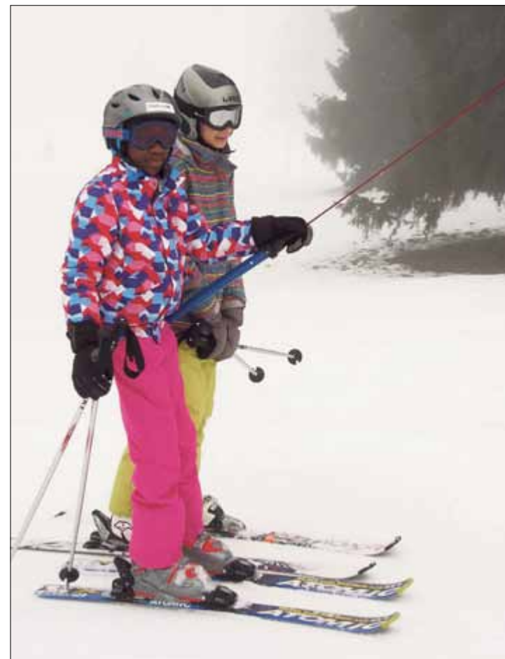
Les écoliers de Corgémont ont accès au Magic Pass et à l'abonnement de saison régional, à des prix exceptionnels

Connaissant désormais les modules disponibles dès le début de la prochaine année scolaire, les parents intéressés pourront plus facilement inscrire leurs enfants aux modules dont ils ont besoin. Ils recevront tout prochainement les formulaires d'inscription ad hoc. | cm