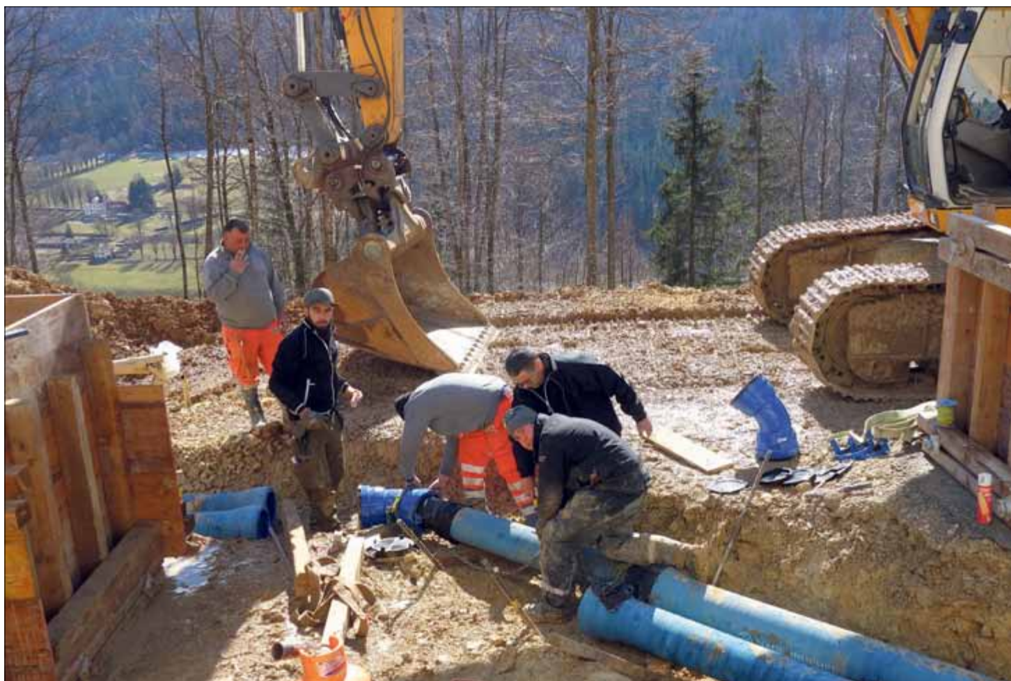
Devant le réservoir des Philosophes, le véritable cœur du nouveau système, la pose des diverses conduites a nécessité un plan en 13 étapes

Le réservoir des Philosophes, ce que ses porteurs qualifient de véritable cœur du projet, vit désormais une phase d'aménagements intérieurs, ainsi que la difficile installation de multiples conduites d'alimentation diverse: arrivée d'eau en provenance des Sauges, départ du précieux liquide vers les réservoirs, électricité, chauffage à distance de l'hôpital, fibres optiques... Le nombre