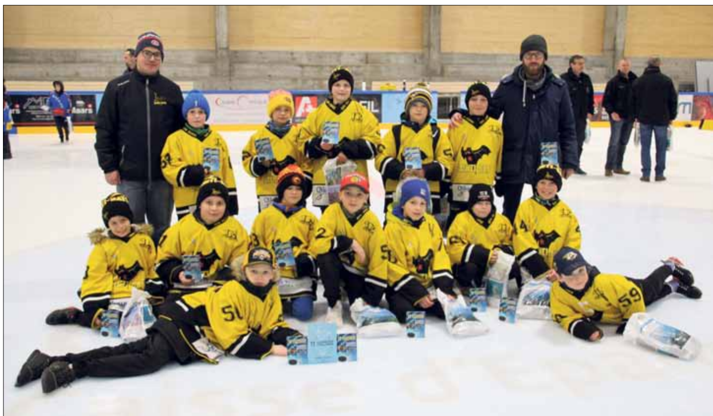
Les Imériens ont reçu le chocolat avec leur quatrième place largement méritée

Outre une saison de championnat pour ses équipes, le HC Saint-Imier a aussi assuré