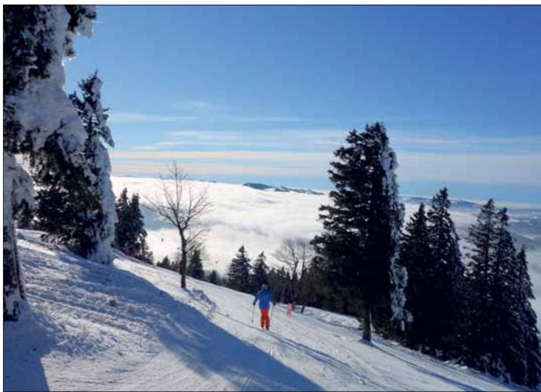
Le CEP promeut le soutien de l'offre sportive existante, notamment celle de ski alpin

Hors l'ancien district de Courtelary, la CEP a listé Bellelay, sa tête de moine et son abbaye, le Musée du tour automatique de Moutier, les vins de La Neuveville, la tour de Moron, la Maison du Banneret Wisard les fauves du Sikypark et les eaux d'Aquavirat.