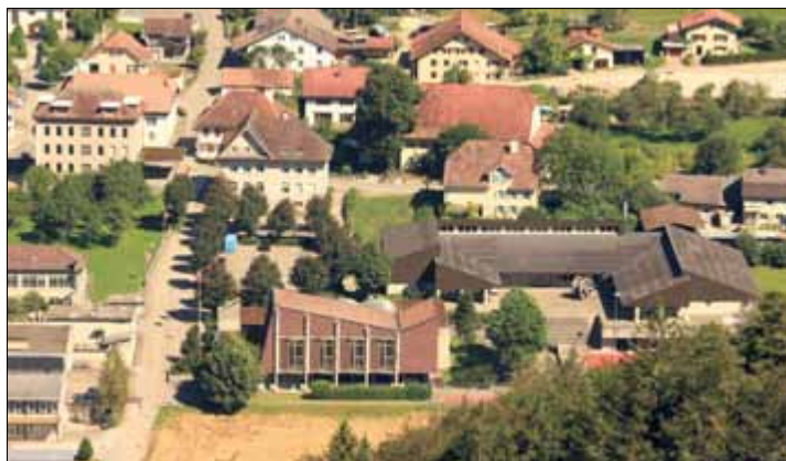
A Péry, le projet de chauffage à distance englobe tout le quartier du centre communal

A ce stade de l'étude, le projet communal de La Heutte consisterait à créer une nouvelle installation, jumelle et sous le toit de celle qu'exploite l'entreprise Heinz Peter; des discussions préalables ont déjà été engagées avec cette dernière, qui n'a pas caché son intérêt. Côte à côte, les deux centrales pourraient se suppléer mutuellement en cas de problèmes techniques. Autre avantage non négligeable: la halle de stockage existante pourrait suffire