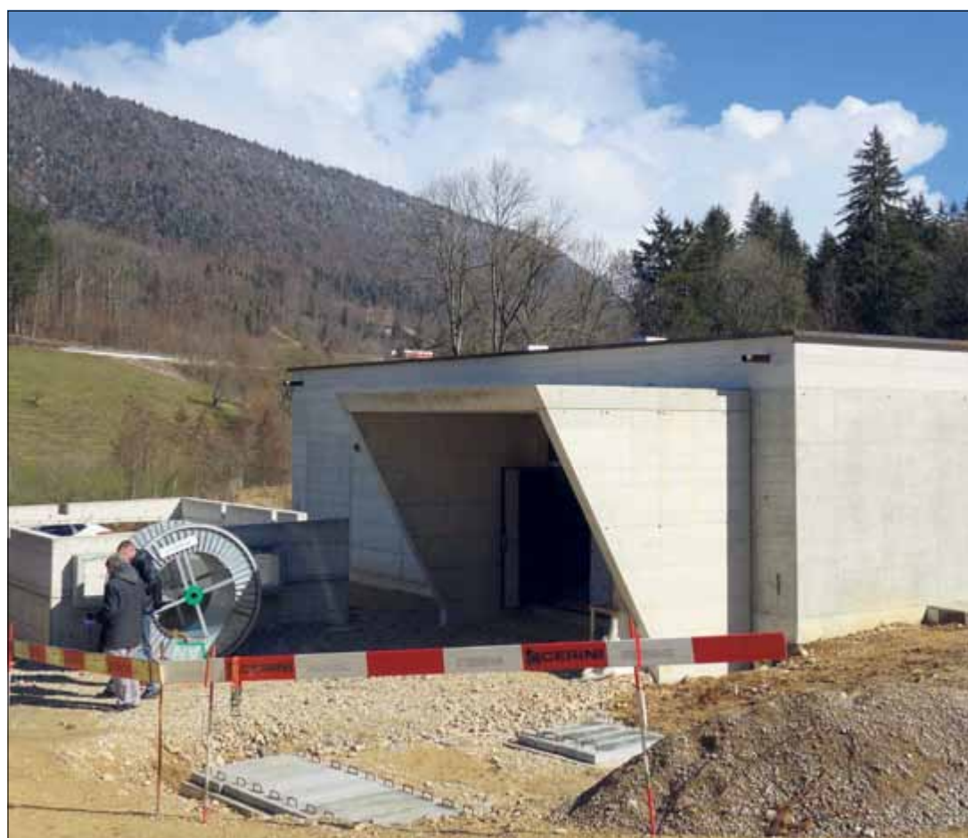
L'eau extraite à la station de pompage du puits des Sauges, bientôt achevée, sera conduite au réservoir des Philosophes, que l'on devine dans la côte de l'endroit, presque au centre de l'image