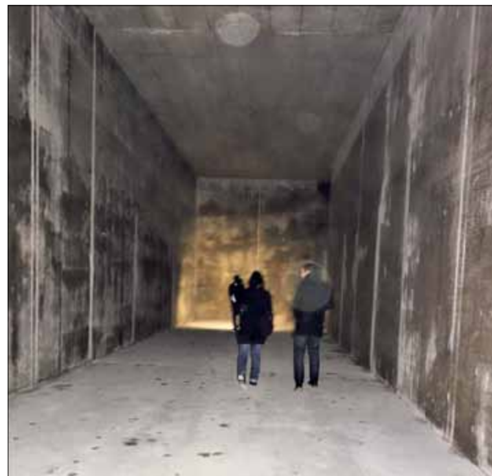
Impressionnantes, les cuves (encore sèches) du réservoir des Philosophes; ici une vue très partielle sur une cuve de 1500 litres...