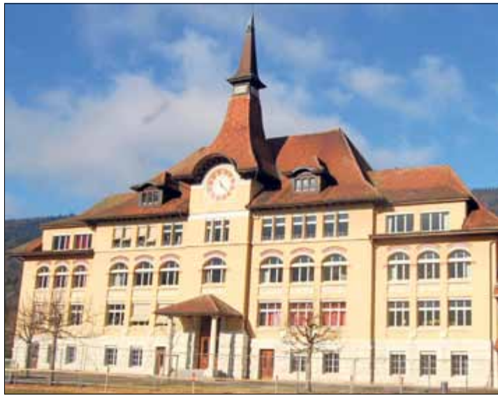
Désormais au complet, la commission ad hoc va plancher sur la rénovation du collège