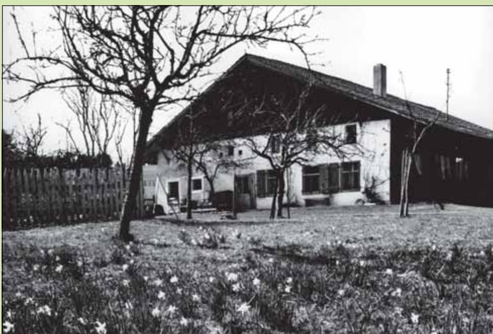
Avant-goût de printemps 1967 à La Paule (Tramelan).