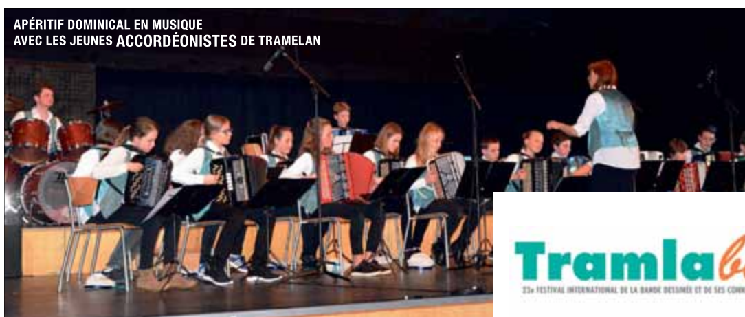
APÉRITIF DOMINICAL EN MUSIQUE AVEC LES JEUNES ACCORDÉONISTES DE TRAMELAN