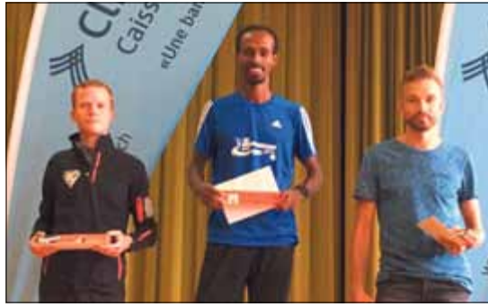
Les podiums des catégories scratch femmes et hommes.

Ce qui frappe à chaque fois les organisateurs, c'est le nombre de nouveaux inscrits. Cela a été une nouvelle fois le cas cette année. De très nombreux participants prennent part à la course pour la première fois,