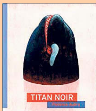
Un roman inspiré de l'histoire vraie de l'orque tueuse Tilikum.

Roman. — Après son bac, Elfie se trouve un job d'été dans un parc océanographique. Très vite, on lui propose de devenir dresseur d'orques. Un boulot de rêve, croit-elle. Elle croit aussi qu'ils sont amis, Titan et elle. Elle croit que dans ce parc, les animaux sont heureux. Mais, si vous ouvrez ce livre, vous y lirez des pages noires. Vous y lirez la véridique histoire de cette orque magnifique, Titan, l'histoire très sombre de la souffrance des cétacés en captivité.