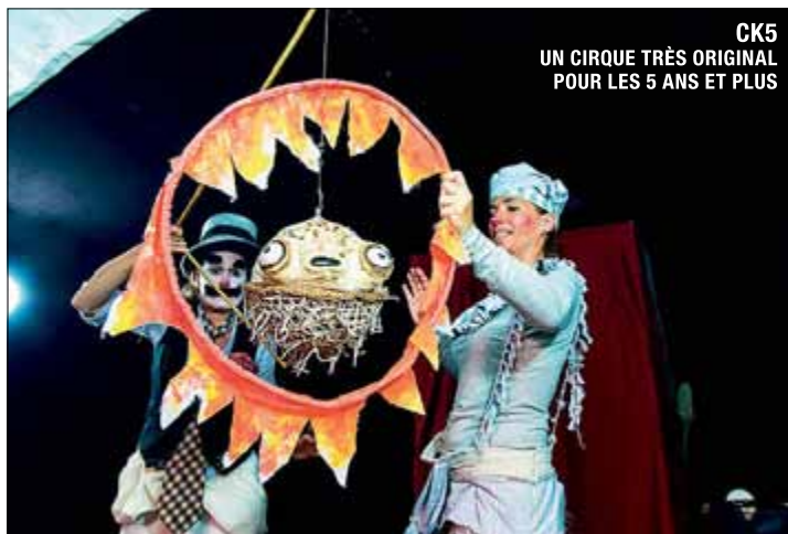
CK5 UN CIRQUE TRÈS ORIGINAL POUR LES 5 ANS ET PLUS