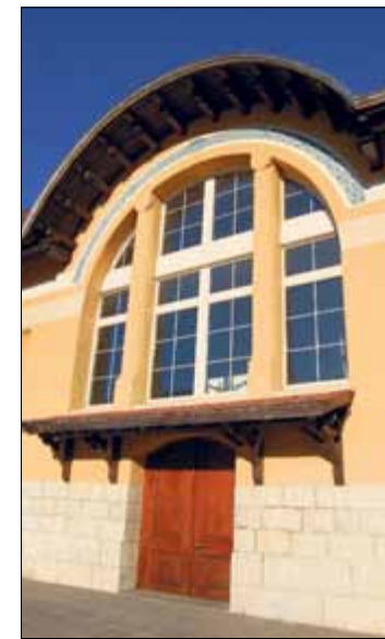
Les utilisateurs réguliers de la halle, notamment, vont recevoir une copie du règlement

Le nouveau règlement est consultable sur le site internet de la commune. Il sera par ailleurs envoyé aux utilisateurs fréquents de la halle et des autres infrastructures. | cm