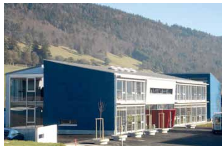
On a notamment parlé de l'école primaire, lundi en assemblée

Première solution envisageable, la collaboration avec une des communes voisines. La question ne se pose pas avec Sonceboz, dont les effectifs sont trop élevés. La Commune de Cortébert serait par contre ouverte à l'accueil de quelques élèves curgismo-dains l'an prochain. Une telle solution ne pouvant être appliquée que sur la base du volontariat, le groupe de travail a lancé un sondage auprès