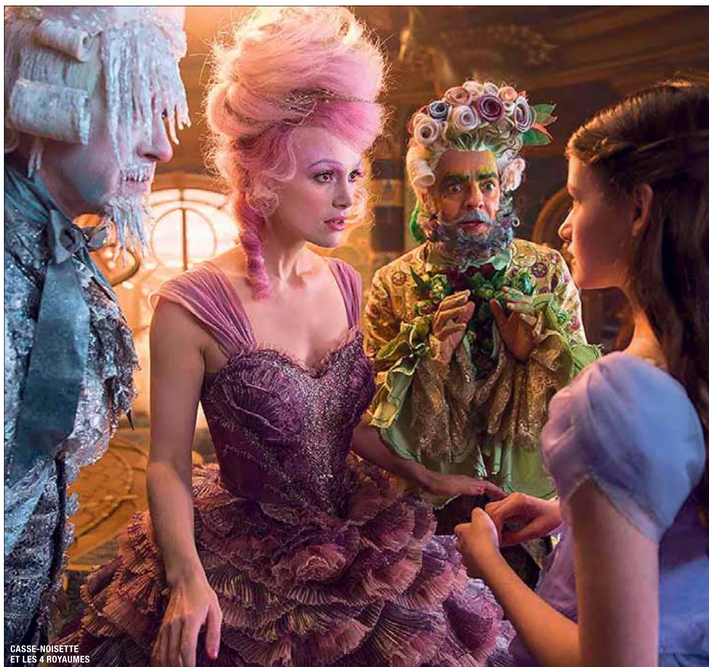
CASSE-NOISETTE ET LES 4 ROYAUMES

de Lassen Hallström, avec Keira Knightley, Jack Whitehall, Morgan Freeman, Helen Mirren. Cette adaptation du conte d'Ernst Theodor Amadeus Hoffman « Casse-Noisette et le roi des souris », qui a inspiré le célèbre ballet éponyme, prend vie sur grand écran. En français. 8 ans (sugg. 10). Durée 1 h 39.