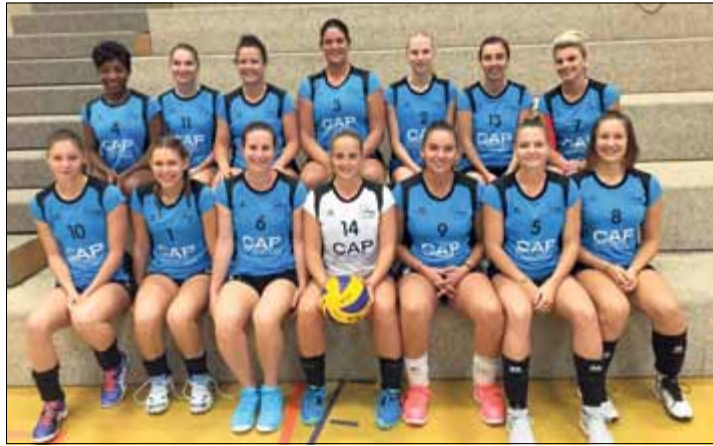
La D2A à un pas du titre de championne d'automne

La H2 (équipe masculine de deuxième ligue, néo-promue dans cette catégorie) affrontera Nidau A, ce soir vendredi à 20h30 à Sonvilier. Un match crucial, qui lui offre la possibilité de s'emparer des commandes du championnat! Demain samedi, c'est à Saint-Imier que battra très fort le cœur du VBC La Suze, puisque trois de ses équipes joueront d'affilée. A 14h tout d'abord, la D3M23 affrontera Porrentruy, une équipe qui la précède immédiatement au classement provisoire; cette rencontre est une occasion