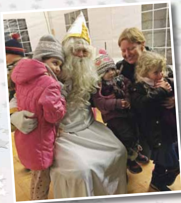
Une foule énorme de bambins aux yeux brillants a pris part jeudi le 6 décembre à la Saint-Nicolas du CIDE.