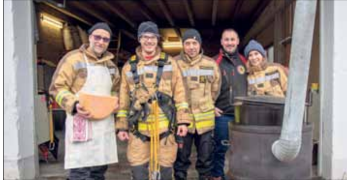
L'équipe de cuisine

excellente soupe aux légumes et raclette attendaient également les visiteurs qui n'ont pas hésité à braver la pluie pour monter dans la nacelle et pour soutenir Téléthon.