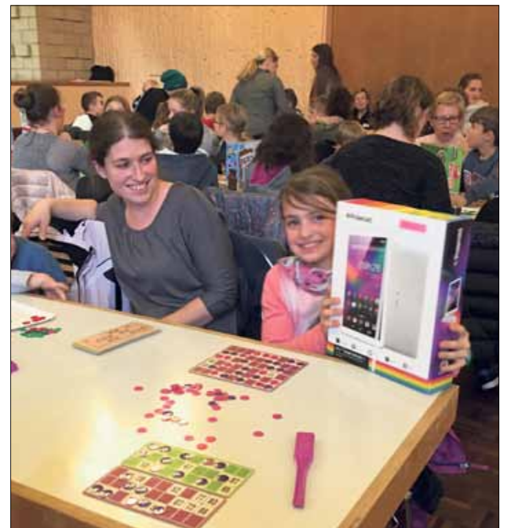
Petits et grands ont apprécié le match au loto de la ludothèque

La ludothèque de Saint-Imier organisait mercredi 28 novembre son match au loto à la salle Saint-Georges. Ce fut un grand succès avec la participation de 101 enfants en âge de scolarité. Les moins de 8 ans étaient accompagnés de leurs parents ou grands-parents. La salle affichait complet avec 168 personnes au total. Chaque enfant a eu droit à 2 cartes et 11 tournées ont été proposées dont 3 royales et une pour les malchanceux. Les lots distribués étaient constitués de jeux de sociétés et même de trois tablettes. A la fin de l'après-midi, une collation a été offerte. Afin de pouvoir continuer à mettre sur pied de telles manifestations et de proposer toujours plus de jeux, la ludothèque est à la recherche de nouveaux membres. Les personnes intéressées peuvent contacter une des membres du comité. La ludothèque est ouverte de 15h à 18h le mercredi et le vendredi sauf pendant les vacances scolaires.